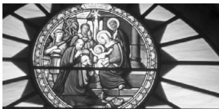
Fra fødselskirken i Betlehem

Gjennom hans inkarnasjon brakte han det guddommelige og menneskelige sammen. Han valgte det som ser verdiløst og håpløst ut for å omforme det til en vakker og hel skapning. Det er denne inkarnasjonen som fant sted her i Betlehem for 2000 år siden som gir oss styrke til å fortsette å se etter ødelagte liv og håp og til å gjenskape det ved hjelp av kunst - til engler med budskap om rettferdighet, fred og verdighet”.