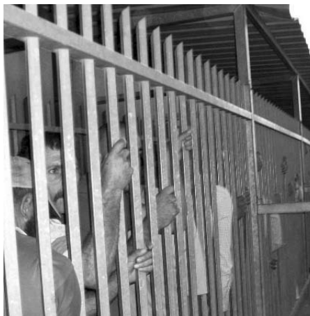
Inntrykkene var sterke!

- Vi besøkte en palestinsk familie som bodde like ved muren – huset deres var blitt ødelagt av israelske soldater 5 ganger og gjennombygd ved hjelp av fredsaktivister -de kalte det et fredssenter.