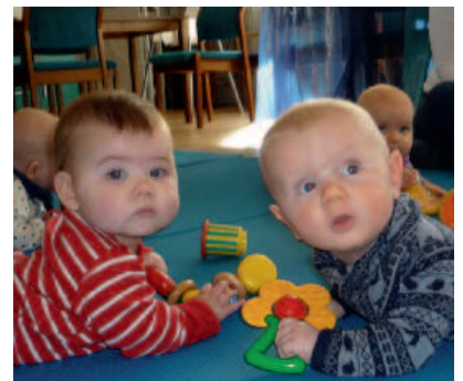
Baby-sangen på Torød og Teie