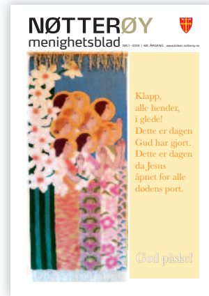
Forsidebildet: Veggteppe i Teie kirke.

Torød kirke og kirkestue 479 74 937 Kirketjener/vaktm. Ingrid Almquist Tripp-trapp åpen barnehage 40 03 48 81