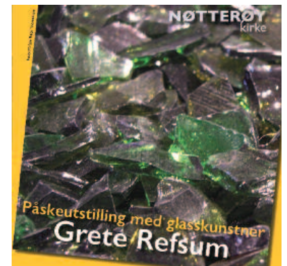
Utstilling i Nøtterøy kirke