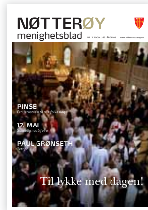
FORSIDEBILDE: Nøtterøy Kirke

Torød kirke og kirkestue 33 38 43 30 Telefax 33 38 66 88 Kirketjener/vaktm. Ingrid Almquist 33 38 43 30