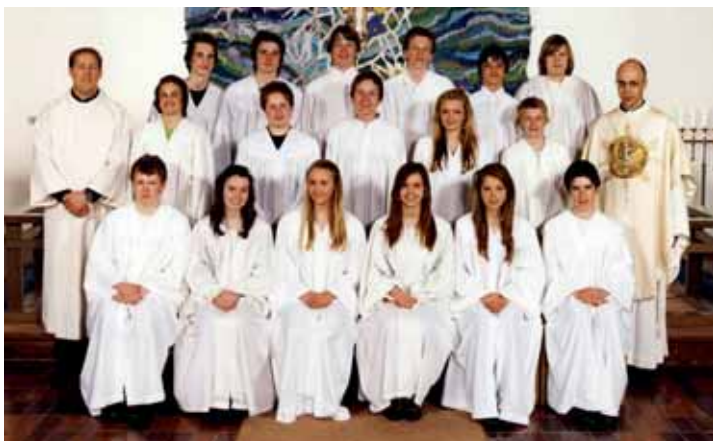
Teie kirke, søndag 10. mai kl 10.30.