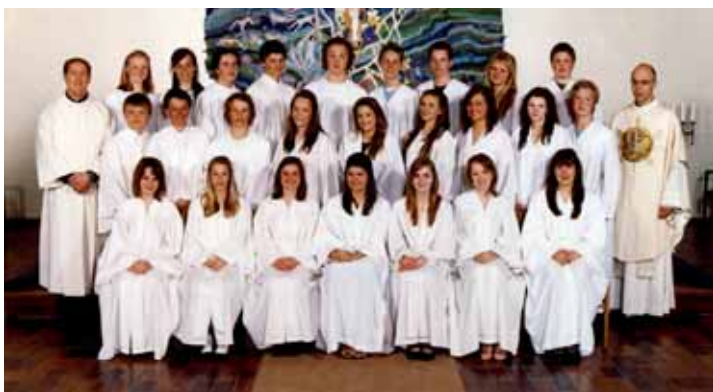
Teie kirke, søndag 3. mai kl 10.30.