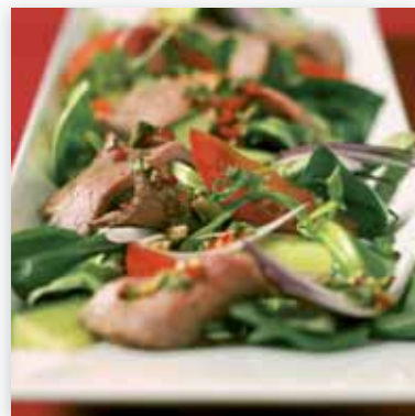
Roastbiff i feriemodus