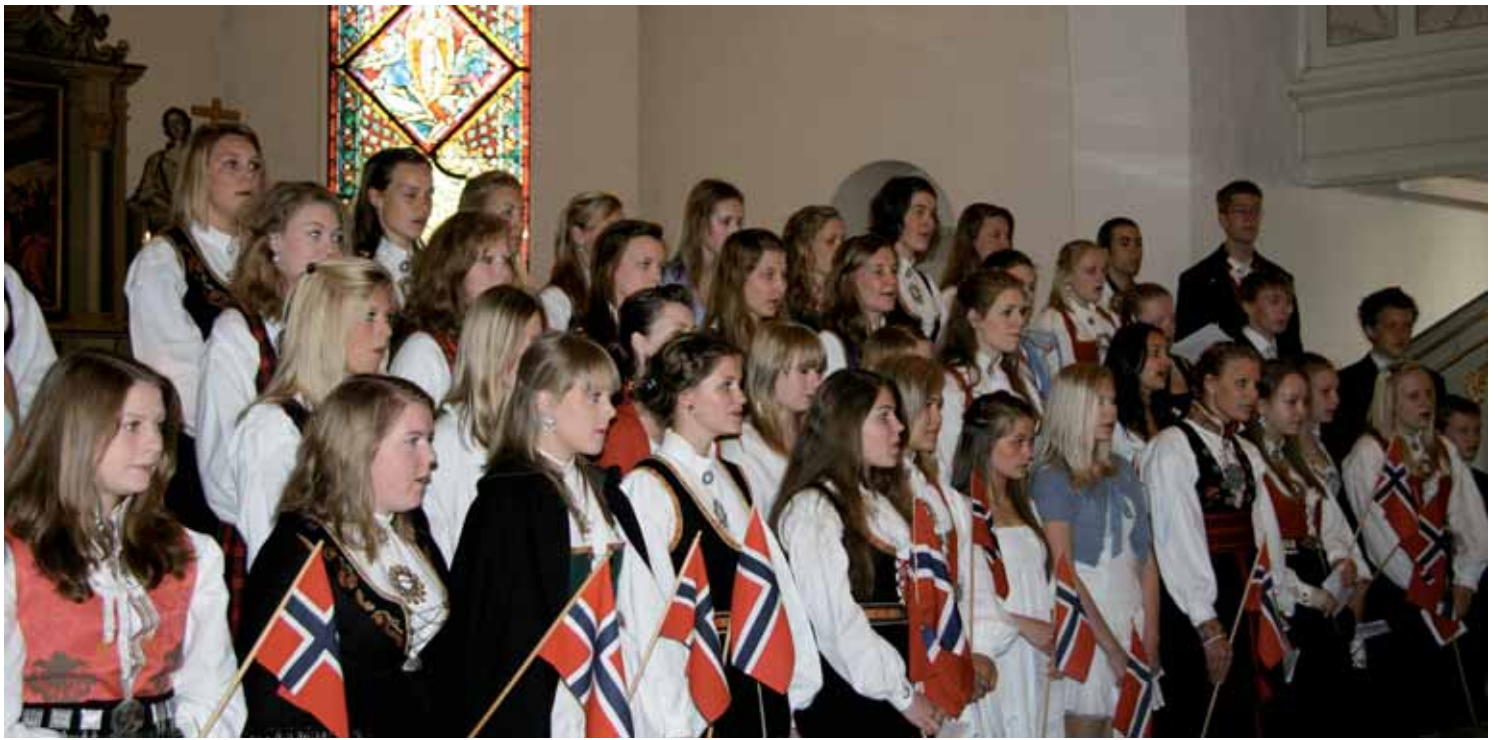
Ungdomskantoriet var pyntet og sang vakkert.