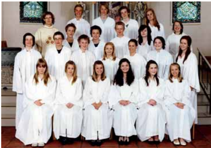
Nøtterøy kirke, søndag 3. mai kl. 10.30.