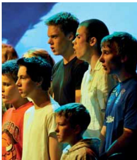
De store gutta.