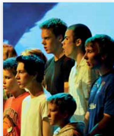
40 gutter som synger