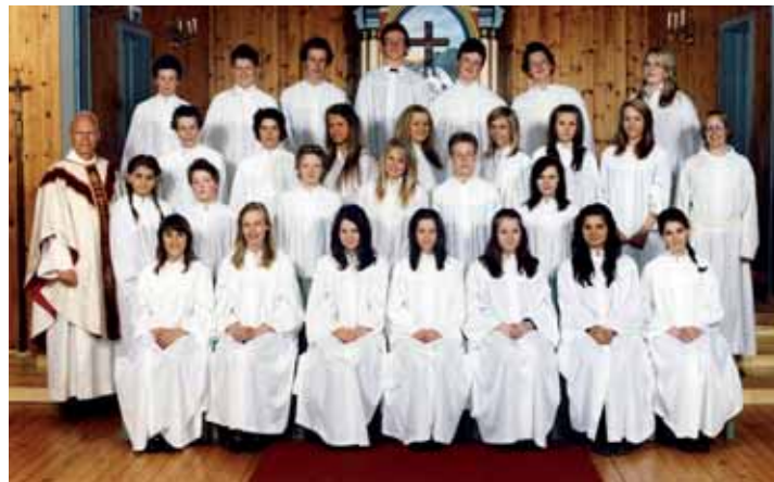
Torød kirke, søndag 3. mai kl 11.00 og 13.00.