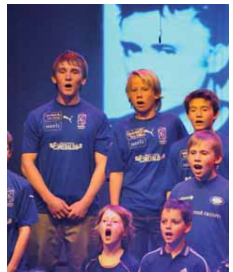
Queen in our hearts.