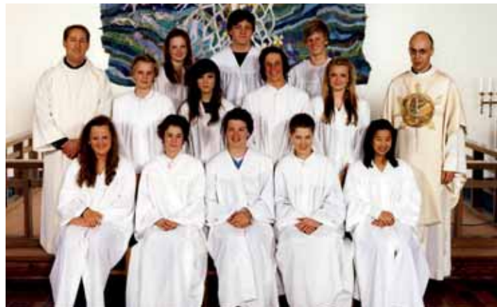
Teie kirke, søndag 10. mai kl 13.00.