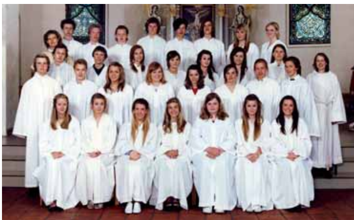
Nøtterøy kirke, søndag 3. mai kl. 13.00.