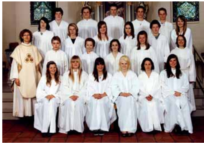
Nøtterøy kirke, søndag 10. mai kl. 11.00.