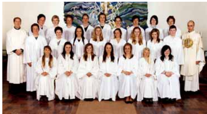
Teie kirke, søndag 3. mai kl 13.00.