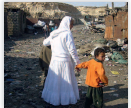
Stefanusbarna i Egypt!