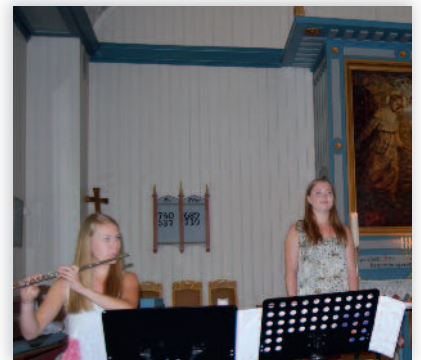
Sommeren på Veierland