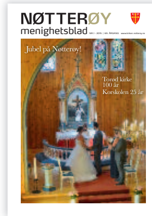
Forsidebildet: Bryllup i Torød kirke

Torød kirke og kirkestue 479 74 937 Kirketjener/vaktm. Katja Lagensteiner Tripp-trapp åpen barnehage 40 03 48 81