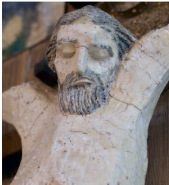
Utsnitt av alterpartiet i Teie kirke.