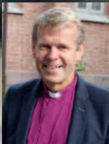
PER ARNE DAHL BISKOP