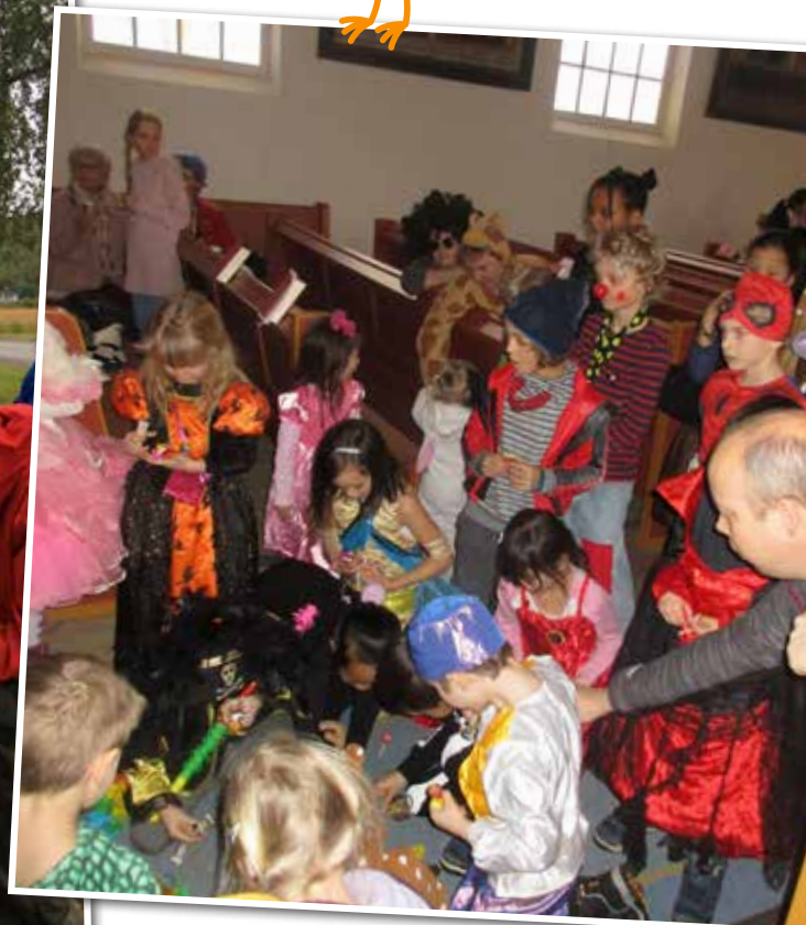
Aldersgruppe 4 år karneval jan 2018.