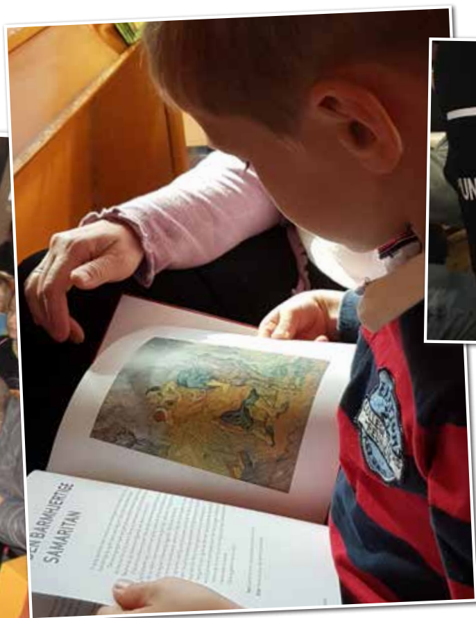
Aldersgruppe 6 år barn og bok.