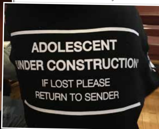
Aldersgruppe 14 år. Snart konfirmant.