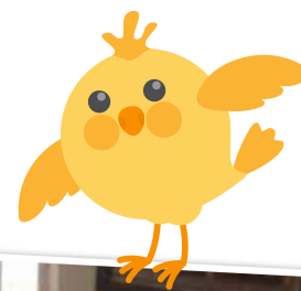
Aldersgruppe 4 år høsttakkefest.