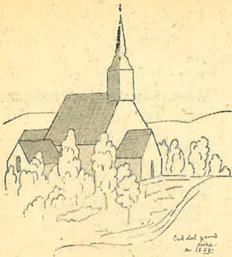
Orkdal gamle kirke av 1899