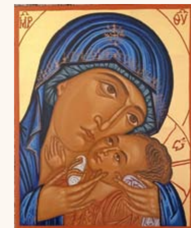
Dette ikonet av Maria - Jesu mor - er malt av Ossama Mosleh som flyktet fra krig og uro fra Syria i 2015.