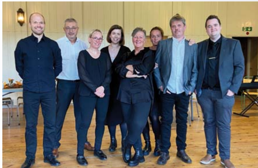
Staben i Meldal og Løkken menigheter

2022 er Frivillighetens år. I regi av Frivillighet Norge er frivillige organisasjoner, kommuner og støttespillere i landet med på å markere hvilken viktig rolle ildsjeler gjør i samfunnet, på en rekke områder, også i kirken. Sammen med resten av landet vårt har også vi i kirka forsøkt å løfte fram alle ildsjelene i Kirka i Orkland. Alle de frivillige som gir av sin tid og sine krefter for å bidra til at kirka er et godt fellesskap. Noen gjør en innsats flere ganger i uka, andre stiller opp én helg i året – alle er verdifulle og viktige. Dette året samlet vi alle våre frivillige og gjorde stas på dem med Frivillighetsfest!