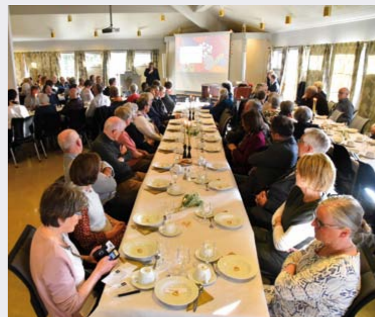
Vi dekket til 120 mann, bordene var stappfulle