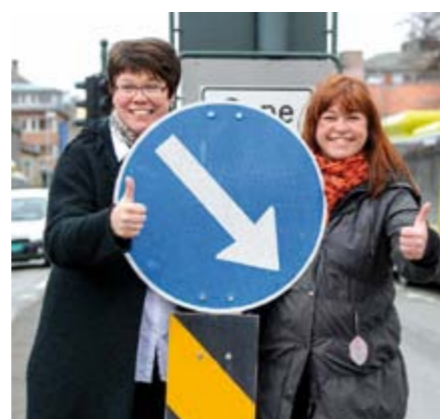
Vei og samferdsel er viktige saker og jobbe med for et inkluderende samfunn

Når jeg så spør hva verden og samfunnets største utfordringer vil ligge i tida framover er hun kjapp kontant og det kan virke som jeg har åpnet opp nok en dør i engasjementet for menneskeverd og mangfold. – Utenforskap! Vår