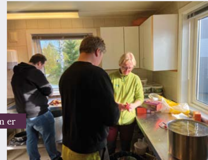
Vår tur til å lage mat til de frivillige!