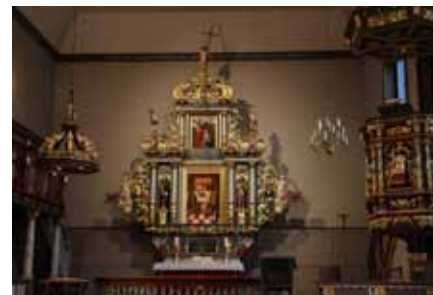
Meldal Kirke sett mot altertavla, prekestolen oppe til høyre og døpefonten med Jesu egen dåp som symbol på den øverste delen som henger fra taket.

I Meldal har dei vore heldige med gode organistar, som kan det å spele