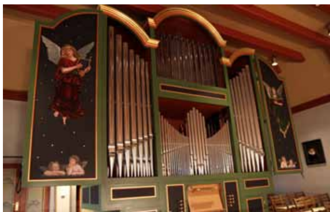
Det flotte orgelet I Meldal Kirke, som til nå har satt toner til gudstjenestene i 35 år allerede.

Heldigvis står det paraplyer i våpenhuset, og vi tek ein tur på uteområdet ved kirka. Gravplassen er ganske stor. I tillegg til Meldal, nytta også Løkken denne gravplassen gjennom mange år da gravplassen der var stengd på grunn av ugunstige jordforhold. Den namna minnelunden