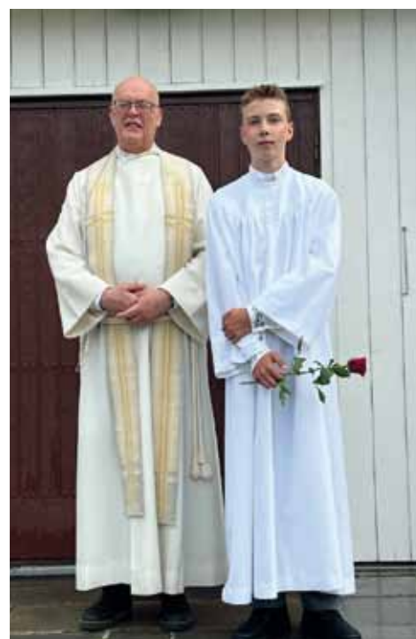
Snillfjord kirke