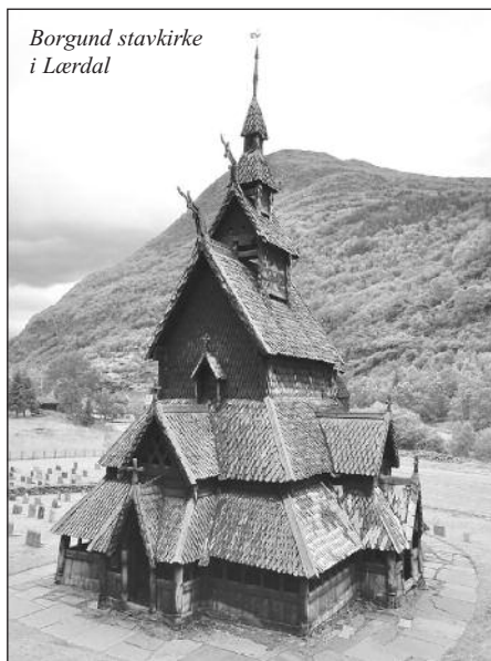
Borgund stavkirke i Lærdal