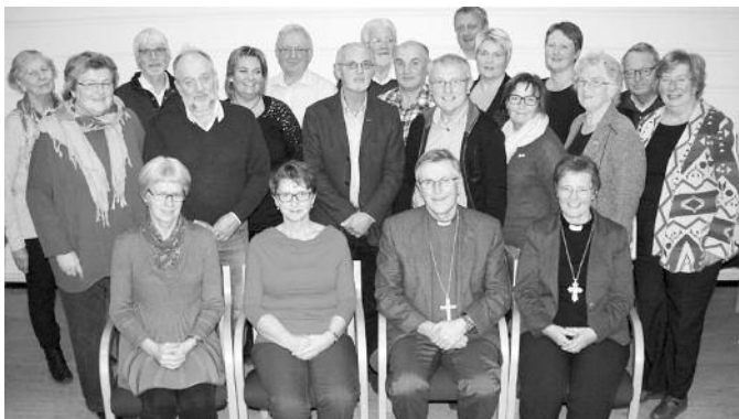
Fra bispevisitasen, menighetsrådene i Bjugn og Ørland, med biskop, kulturrådgiver og prost

Ørland menighetsråd har arbeidsgiveransvar for ni ansatte og engasjerte, det utgjør vel 4 årsverk.