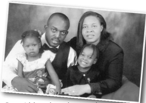
Pastor Adah etterlot seg kone og to barn

Tidligere var det i land med ateistisk styre, slik som Sovjet, Kina, Nord-Vietnam og Nord-Korea, Cuba og Laos, en kunne lese om slike forfølgelser, men nå er det altså blitt kjent at det skjer voldsomme overgrep mot enkeltmennesker og folkegrupper også i mange andre land.