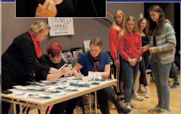
Fra trekningen av hovedlotteriet, konfirmanter hjelper til