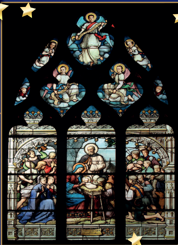
GLASSMALERI, SAINT SEVERIN KIRKE, PARIS, FRANKRIKE

Guds Sønn steg ned å tjene og gav for oss seg hen. Da falt et frø i jorden til evig liv isjen.