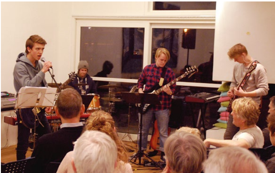
«Vondt i viljen».