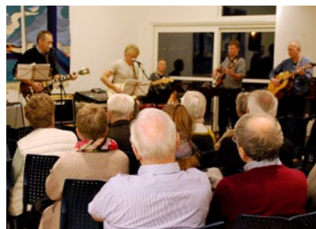
«Vondt i ryggen»