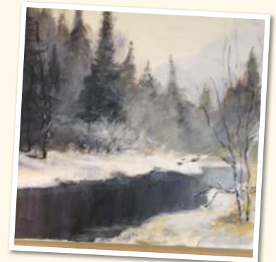
Maleri av Carl. I. Frønsdal