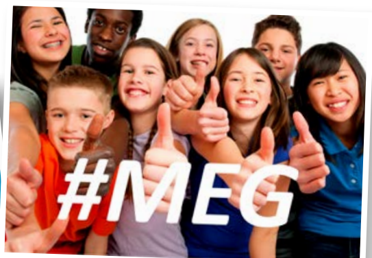
#MEG arrangerast 19. mars for alle 13-åringar i kommunen