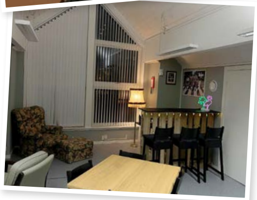
Dei nye lokalene.