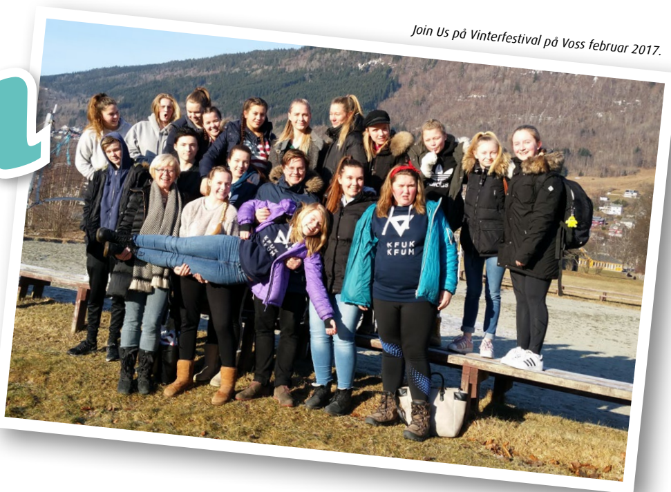
Join Us på Vinterfestival på Voss februar 2017.

Også dans, drama, band og lydteknikk! Men det er ikkje berre sang vi driv med. Om du er glad i eller har lyst til å danse, spela drama, spela i band eller læra om lys- og lydteknikk er Join Us også noko for deg! For ca ein gang i månaden har vi tema-øving der vi deler oss i desse gruppene. Då er ein fast med i same gruppe gjennom heile året. Her, som på dei vanlege øvingane, jobbar vi fram mot det store vårshowet som Join Us har kvart år.