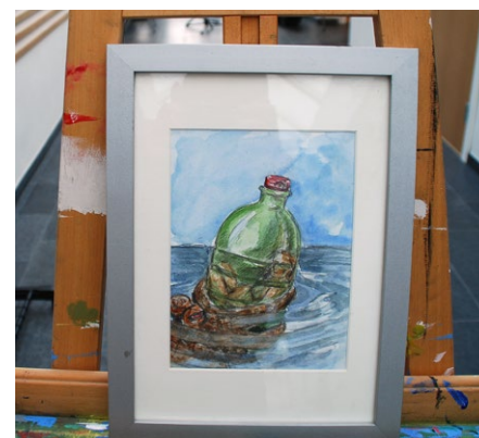
Bilete er måla av Vidar Bratlund-Mæland.