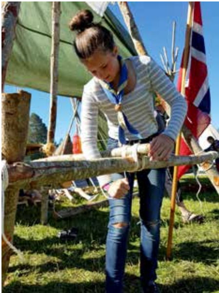
På landsleir lærar vi å pionere.