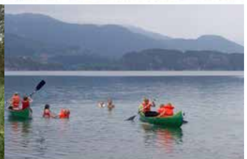
I Rolsvågen var det mange aktivitetar, Førstehjelp og kanopadling var nokre av dei.