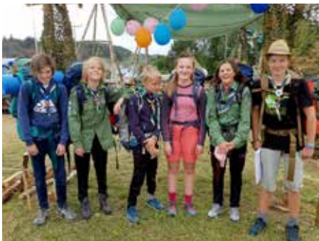
Ein patrulje er for haik.