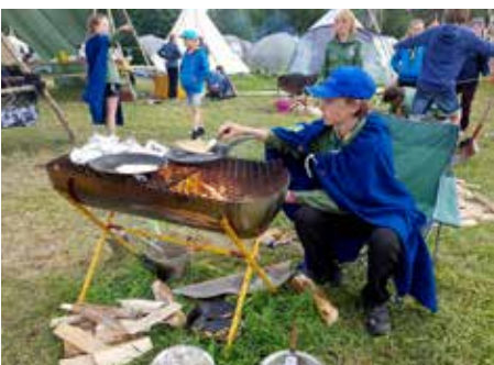
Mat på bål.