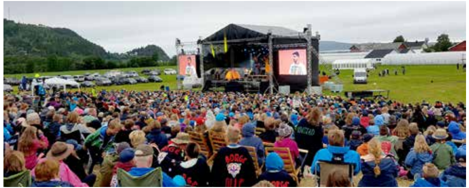
Leirbålsunderhaldning med 4000 speidarar.