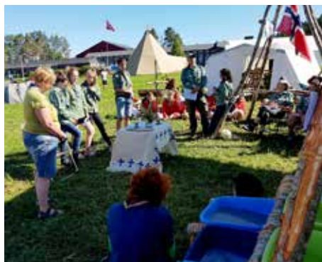
På landsleiren ble det arrangert gudsteneste for nokre av gruppene.