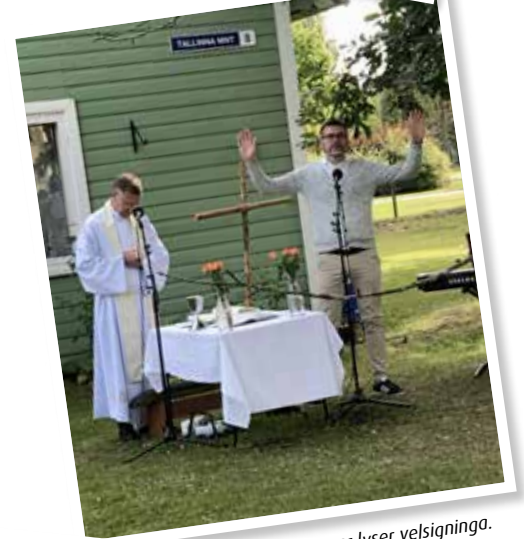
Roar lyser velsigninga.