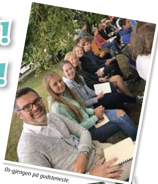
Os-gjengen på gudsteneste.

Veka i Estland blei ei stor oppleving for alle som var med, store som små, ungdom og vaksne. Både sosialt og åndeleg har deltakarane fått vekse, og vi håpar på gjentakning ein gong i framtida.