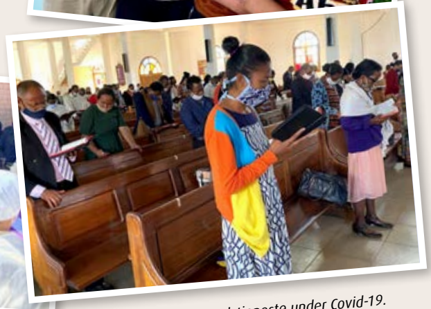
Begravelse av tidligere kirkepresident Rabenorolahy Benjamin.