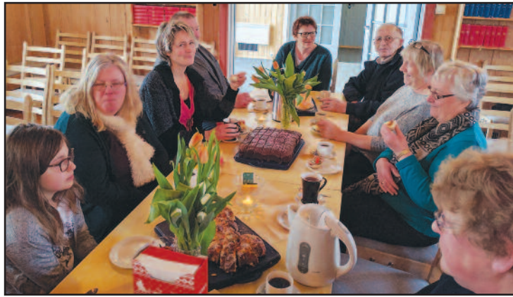
I Dalsbygda dekker vi langbord i kirka med god servering og hyggelig fellesskap. Det gir en ekstra trivelig ramme rundt årsmøtet.