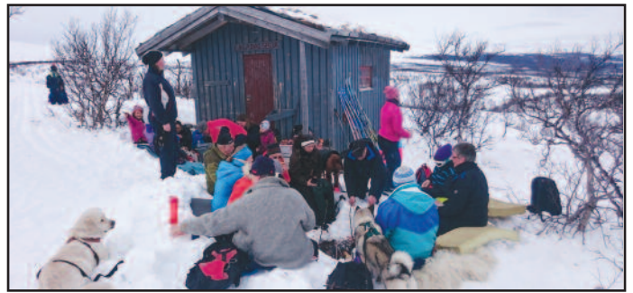
Engådalsbua i bruk under en av Tufsingdal IL sine utflukter i 2016.

Engådalsbua har gjennom 30 år blitt flittig brukt, noe som utskrevne hyttebøker vitner om. Her er det små og store historier fra fornøyde gjester som har tatt en rast i løpet av fjellturen sin, til fots eller på ski. Gjennom årene har vi hatt sportsandakter, kaffe/vaffelsalg, og også ved flere anledninger ble det solgt suppe til ivrige skiturister som Narbuvooll fjellstue sørget for. Vi håper fortsatt at bua blir flittig brukt og ønsker alle som ferdes forbi og tar en rast på sin ferd i fjellet velkommen inn.