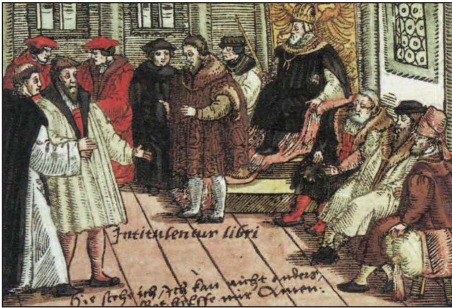
Luther står frem for riksdagen (kolorert tresnitt, 1557). Slike tresnitt ble spredd over hele Europa, og bidro til å gjøre Martin Luthers tanker – og mot – kjent.