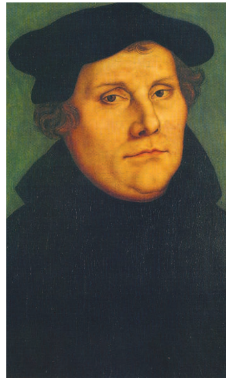
Portrett av Martin Luther, malt av Lucas Cranach, Lutherhaus Wittenberg.

For å skaffe penger til oppførelsen av Peterskirken i Roma, hadde Pave Leo X satt i gang en omfattende handel med avlatsbrev. Et avlatsbrev var et dokument som ettergav straff på jorda og i skjærsilden. Da dominikanermunken Johann Tetzel i 1517 begynte å selge av-