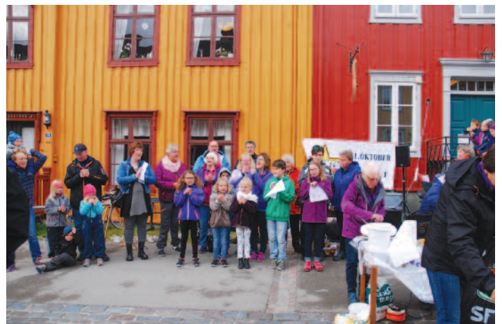
Os familiekor i full sving under Barnas dag på Røros.