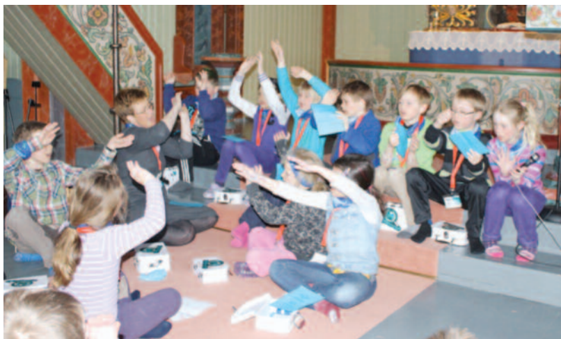
Sangøving: «Kom, kom, kom å få en himmel over livet».

«Uten mat og drikke, duger tårnagenten ikke».