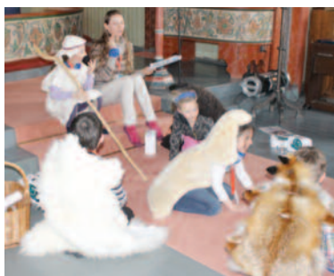
Øving på prekateksten til søndag.