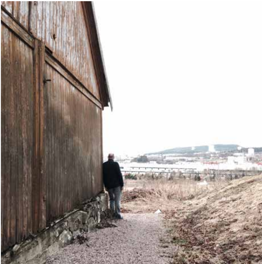
Det endelige vinnerbildet fra «Mobilfotografene»