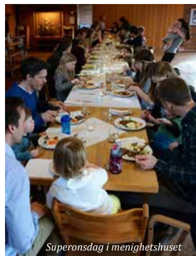
Superonsdag i menighetshuset

rigent@mbuk.no). Se også: www.mbuk.no eller finn oss på FB.