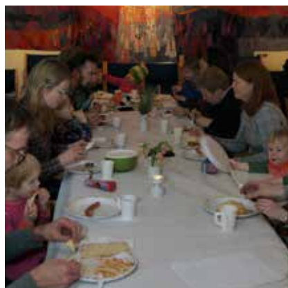
Supermandag i Bakkehaugen

Bakkehaugen støtter et misjonsprosjekt drevet av Det Norske Misjonsselskap med fokus på evangelisering og menighetsbygging i Kamerun. Prosjektet gir blant annet støtte til barne- og ungdomsarbeid og til en preste- og bibelskole. Det er kollekt til misjonsprosjektet flere ganger i løpet av året.