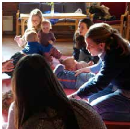
Småbarnssang under Superonsdag

Vestre Aker har samarbeidsavtale med Det Norske Misjonsselskap om prosjektet «Fokus Thailand: Budskap – Bistand». Prosjektet fokuserer på barn og utdanning i slummen og kirkelig undervisning i regi av Den evangelisk-lutherske kirken i Thailand. Prestegårdens misjonsforening er tilknyttet NMS, og støtter opp om menighetens