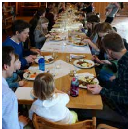
Superonsdag i menighetshuset