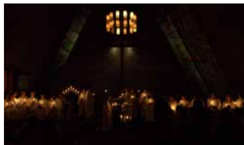
Lysmesse i Bakkehaugen 10. desember