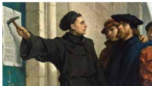
Reformasjonsjubileum i Vestre Aker 29. oktober