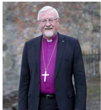
Biskop Kvarme kommer på Tro- og tankekveld 18. september.