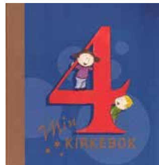
4-årsbok i Bakkehaugen 17. september