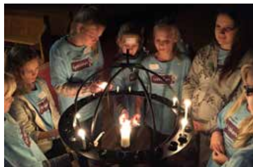
LysVåken i Vestre Aker 2.-3. desember