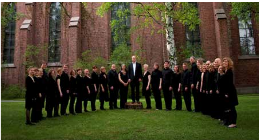
Vestre Aker kammerkor

Utleie av kirkerommet skjer etter særskilte regler med søknad på epost til menighetskontorets adresse. Post.bmv.oslo@kirken.no