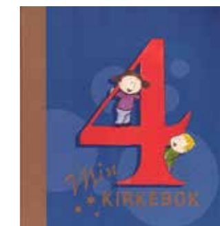
4-årsbok i Vestre Aker 16. september