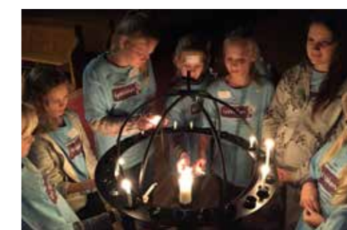
LysVåken i Bakkehaugen 10.-11. november