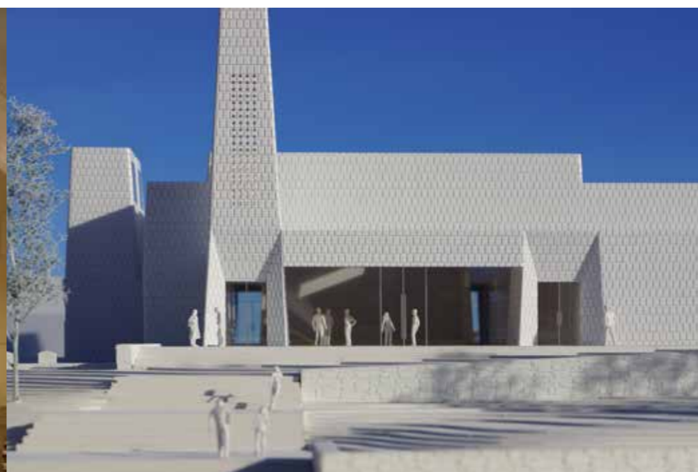
Østre Porsgrunn kirke. Modellbygger Simon Sieger