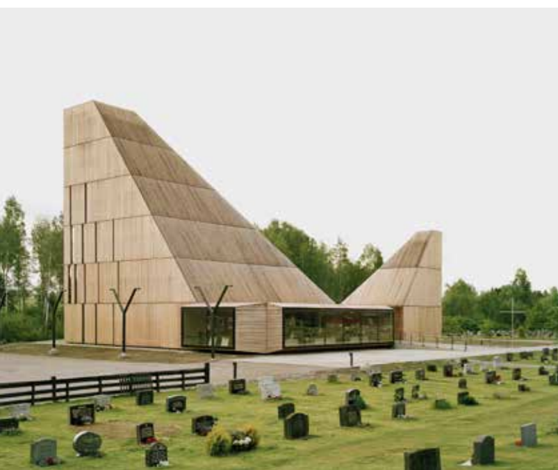
Våler kirke, vigslet i 2015.

– Det hender jo at en snekker slår fingeren sin og sender ut noen gloser, og da har vi det litt morsomt med at bygget jo ikke er vigslet ennå, så da går det helt greit. Selve vigslingen er en sterk symbolsk handling, og det er en ganske emosjonell opplevelse å delta som arkitekt for bygget. Det er vanskelig å si hva som skjer, men jeg opplever at huset blir et annet etter vigslingen, avslutter arkitekturprofessoren.