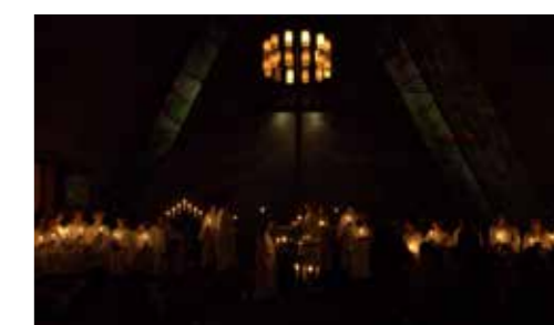
Lysmesse i Bakkehaugen 9. desember