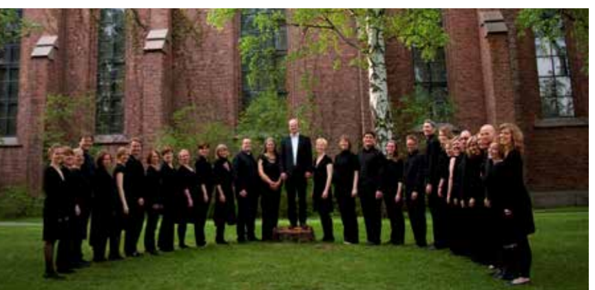
Vestre Aker kammerkor

Den tradisjonelle julekonserten Hellige Natt fremføres lørdag 15. og søndag 16. desember, begge dager