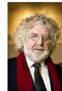
Edvard Hoem er gjestetaler på nærmiljøgudstjeneste i Bakkehaugen 3. mars.