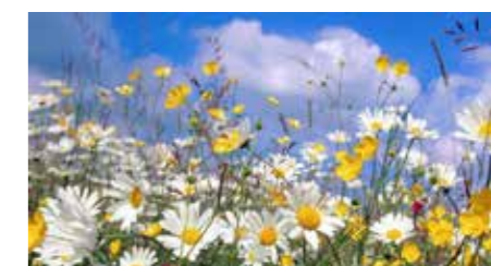
Blomstermesse i Bakkehaugen 16. juni.