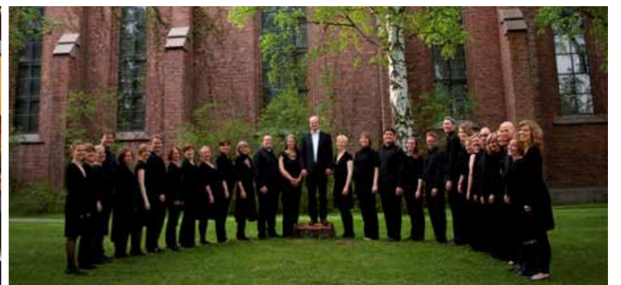
Vestre Aker kammerkor

En tirsdager i måneden inviterer vi 10. klassinger til Tacotirsdag kl. 15-17 i Vestre Aker menighetshus. Vi spiser sammen, og kommer du litt tidlig kan du være med å lage mat også. Her er det mulighet til å henge, gjøre lekser om det trengs, og snakke med venner og ledere. Datoer finner du på nettsidene våre.