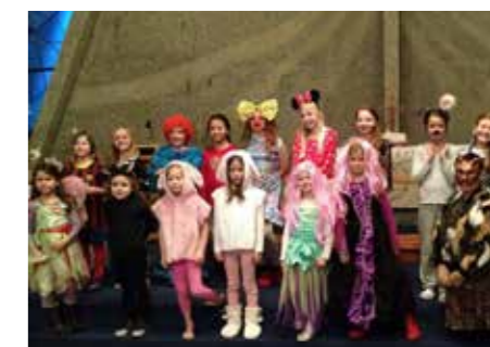
Karnevalgudstjeneste i Bakkehaugen 17. mars.