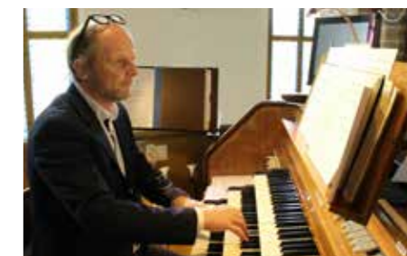
Orgelresitasjon og pasjonsgudstjeneste i Vestre Aker langfredag 19. april.