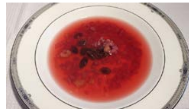
Saftsuppe med bringebær og byggryn.