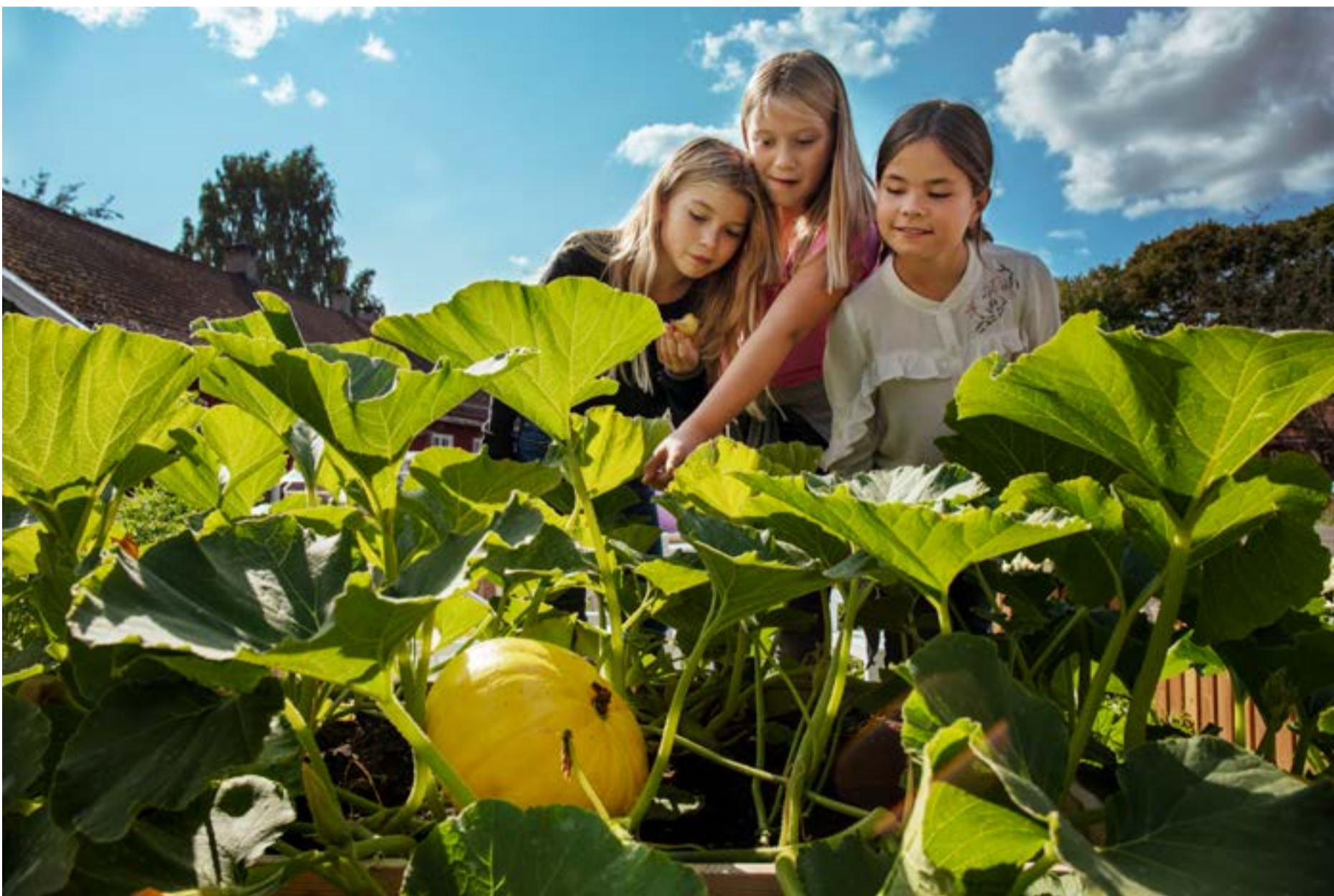
Fra bagen på Bekkelagstunet.

Tekst: Anne Borgersen Skaug