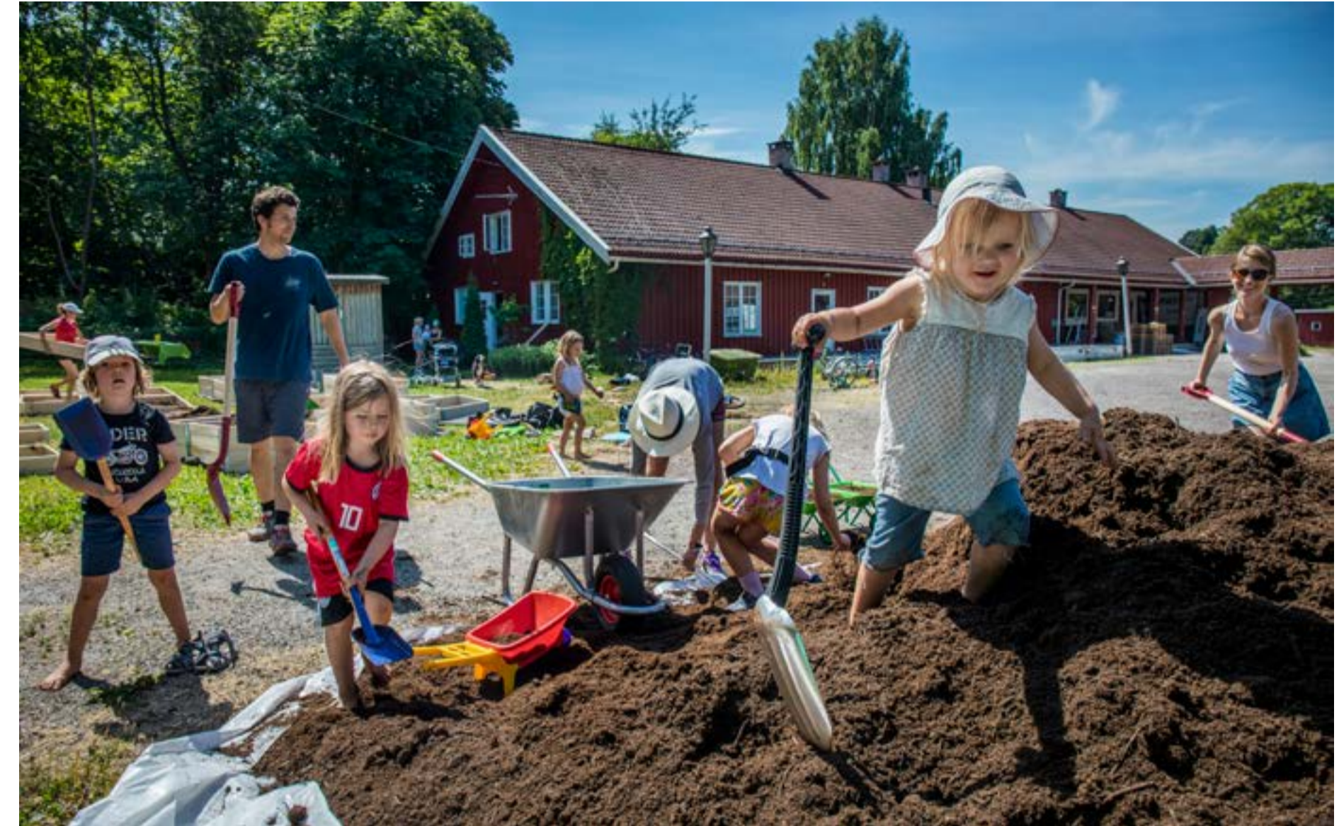
I full gang med jorden.

Stiftelsen har fått økonomisk støtte til flere av arrangementene, noe de er svært takknemlige for. Tillik legger vekt på at man ønsker at hele