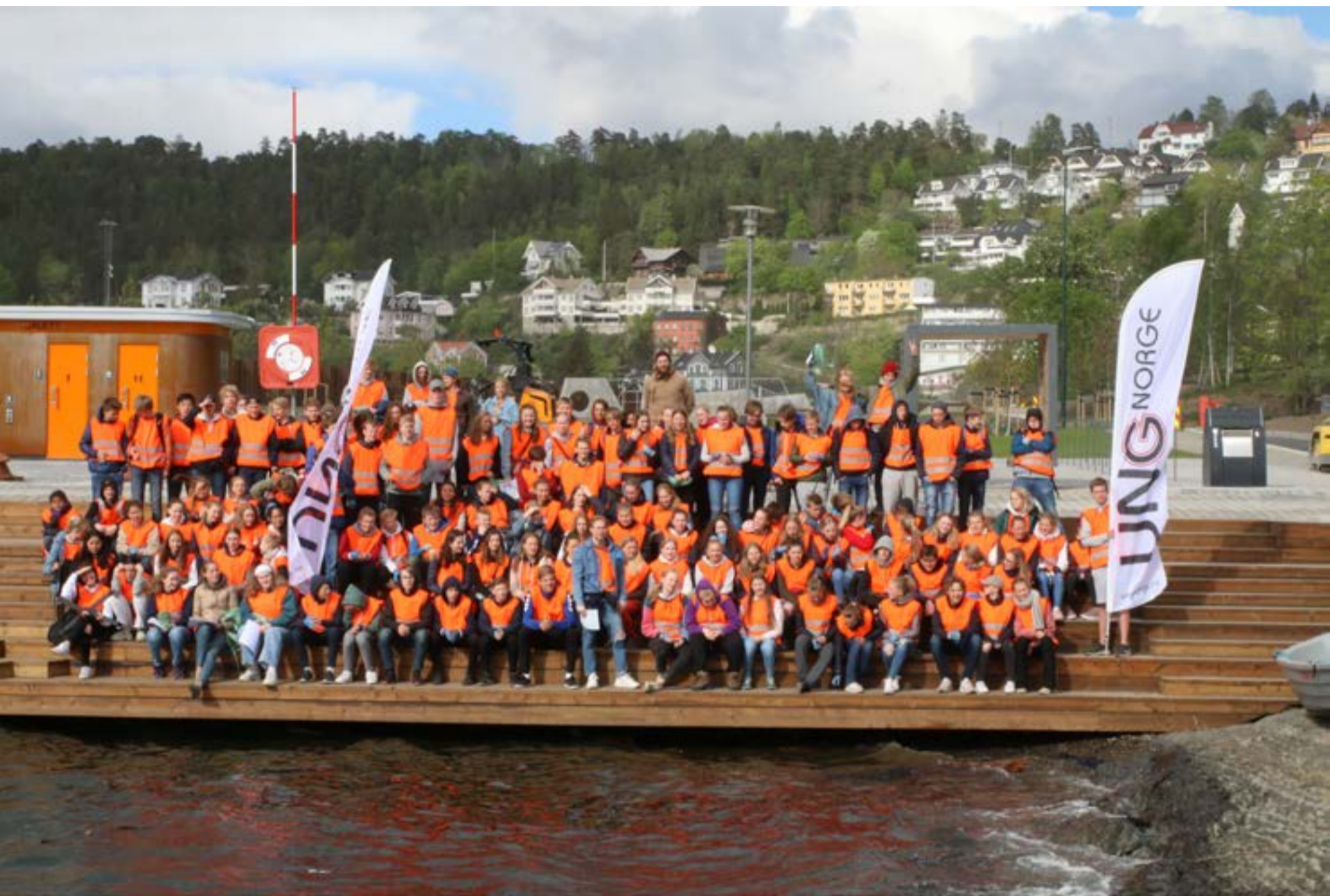
Årets konfirmanter har deltatt på ryddeaksjon og plukket plast og annet søppel langs sjøen.