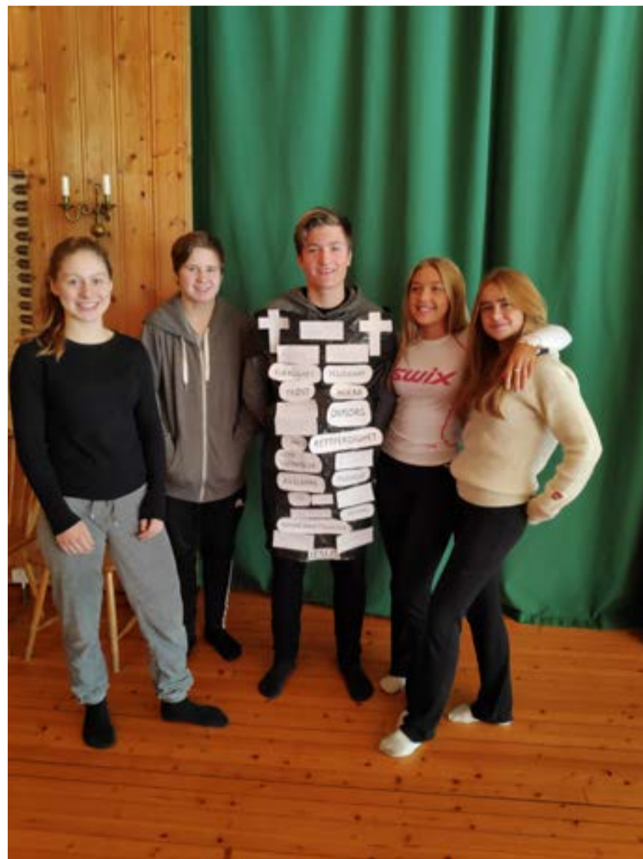
Et par av ungdommene som var med på weekendtur til Østmarkskapellet.

I etterkant av helgen sitter jeg igjen med takknemlighet over å bli bedre kjent med ungdommene, få ta del i deres trosreise og refleksjoner, og få se gjengen bli litt mer sammensveiset enn før. Og hvem vet – om 15 år er det kanskje en av disse som er på tur med et nytt lederkurs til Østmarkskapellet, eller forretter nattverden i Bekkelaget og Ormøy menighet.