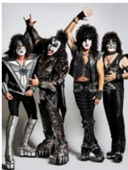
KISS sin aller siste konsert i Norge blir på Ekebergsletta.

- Dere ble kåret årets festival i 2017. Hva tror dere er grunnen til det?