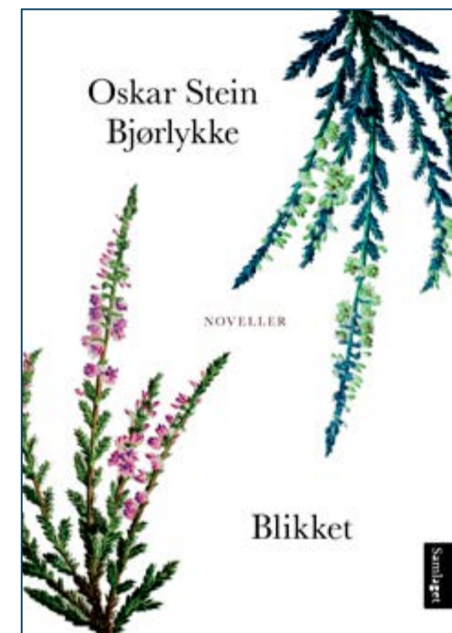
Omslaget til novellesamlingen "Blikket".

Blikket inneholder 16 korte noveller, er tilgjengelig hos Samlaget og har fått god kritikk fra blant annet avisen Vårt Land.