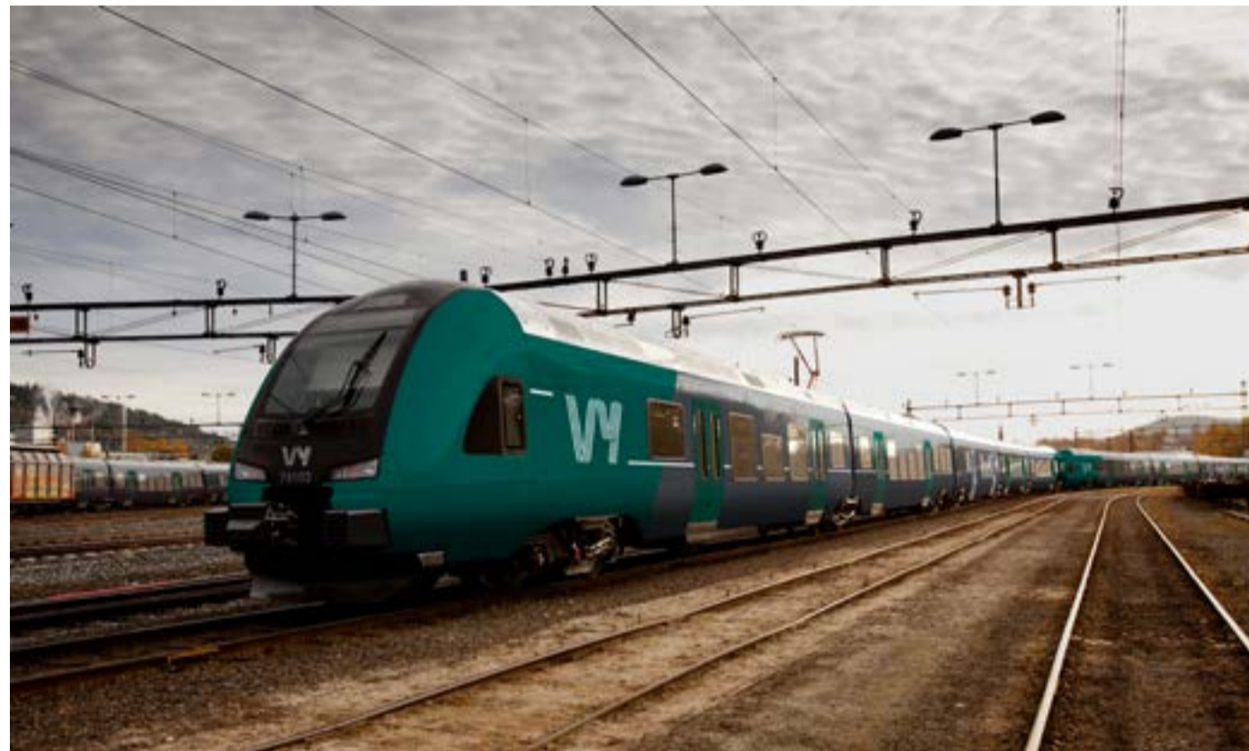
Tog i Vy-drakt.

Det som det bør settes søkelys på er hvorfor disse endringene gjøres. I forbindelse med navnebyttet så er det slik at NSB slik det var, ikke finnes