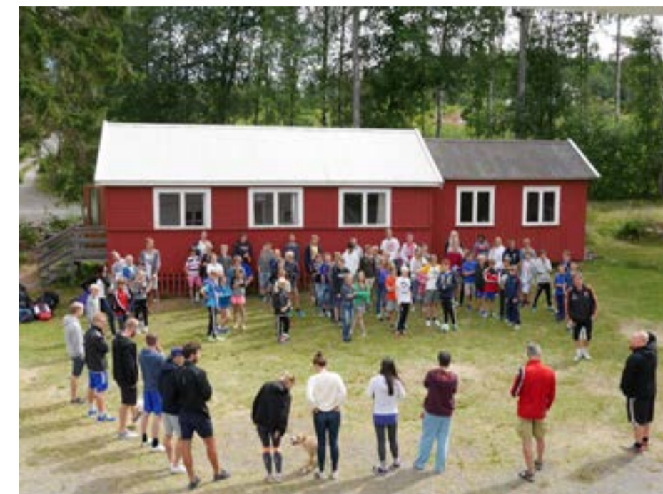
KFUM kameratene har ett leirsted nede i Son hvor klubben arrangerer tre leirer hver sommer med til sammen rundt 200 unge deltakere!