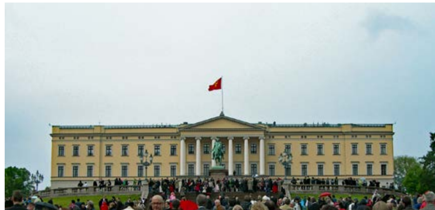
Det kongelige slott.

Hvis man trekker dette opp noen nivåer, til det nasjonale, så er det det samme her. Norge som et selvstendig land tillater ikke overstyring fra fremmede stater. Vi har våre egne lover og regler som vi følger. Samtidig inngår Norge forpliktende avtaler med andre (EØS, EU osv.). Men dette er noe vi har valgt å gjøre.