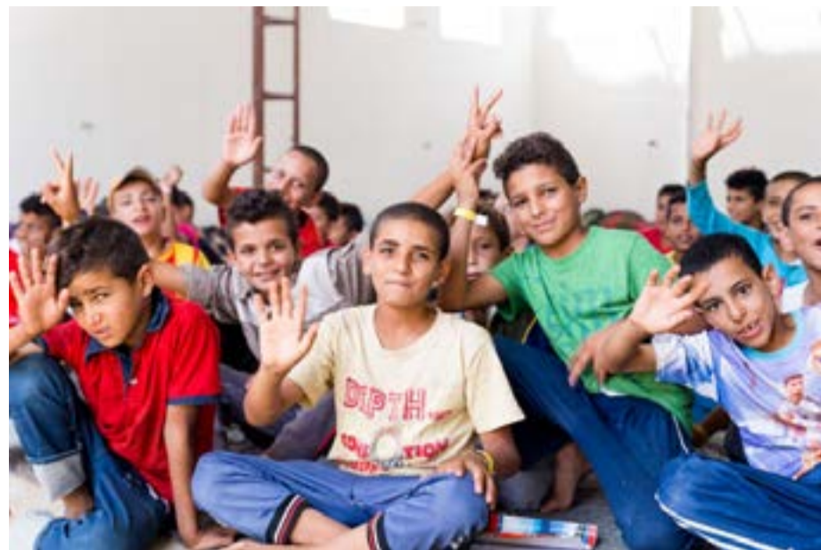
Gutter på leir.

Derfor må guttene ut i arbeid for å forsørge familien sin. Arbeidsplassene de ender opp på er farlige. Det er ingen arbeidsfor-sikring, det er ingen beskyttelse eller verneutstyr og flere opplever misbruk, også seksuelle misbruk. Lederen for «Second Chance»-programmet intervjuer guttene før de kommer til Anafora. Dette gjør de nøye for å velge ut de mest utsatte, sårbare og fattige. Lederens tilbakemelding er at guttene gleder seg stort over å være på Anafora!