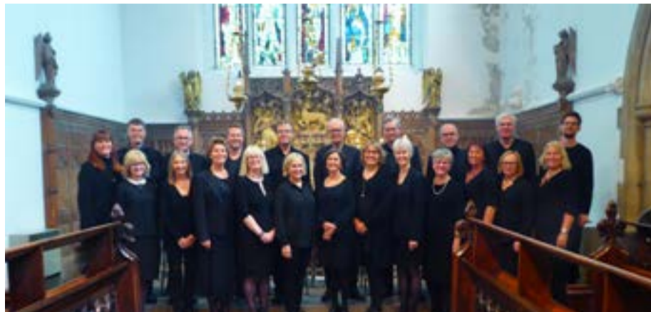
Cantando 20 år. Fra Church of St. Olave's.