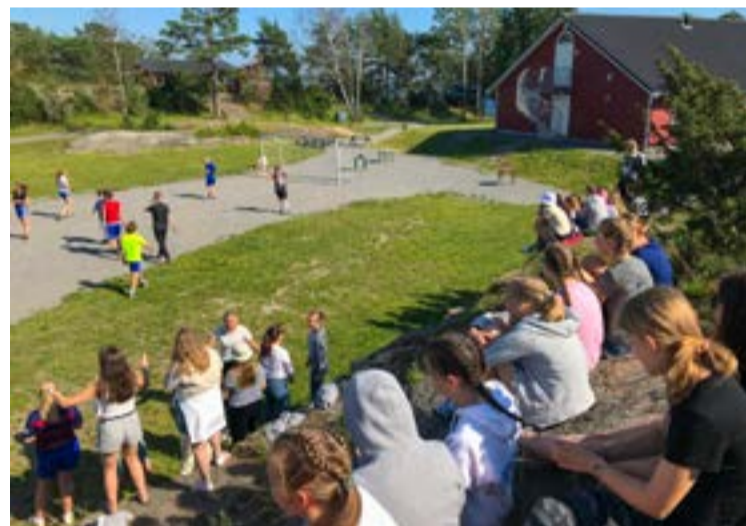
Fotballkamp, lederne mot konfirmantene.