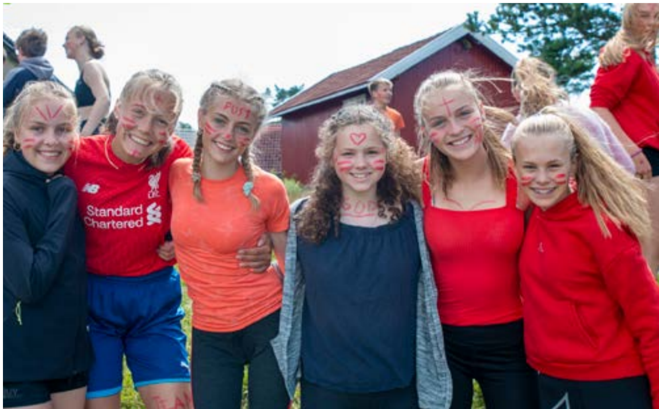
Et av lagene fra bli-kjent-aktiviteten første dag: «Get wet or die trying».

Takk for et flott konfirmantår! Takk til alle konfirmanter, ledere og foreldre for dette konfirmantåret, det har vært fantastisk!