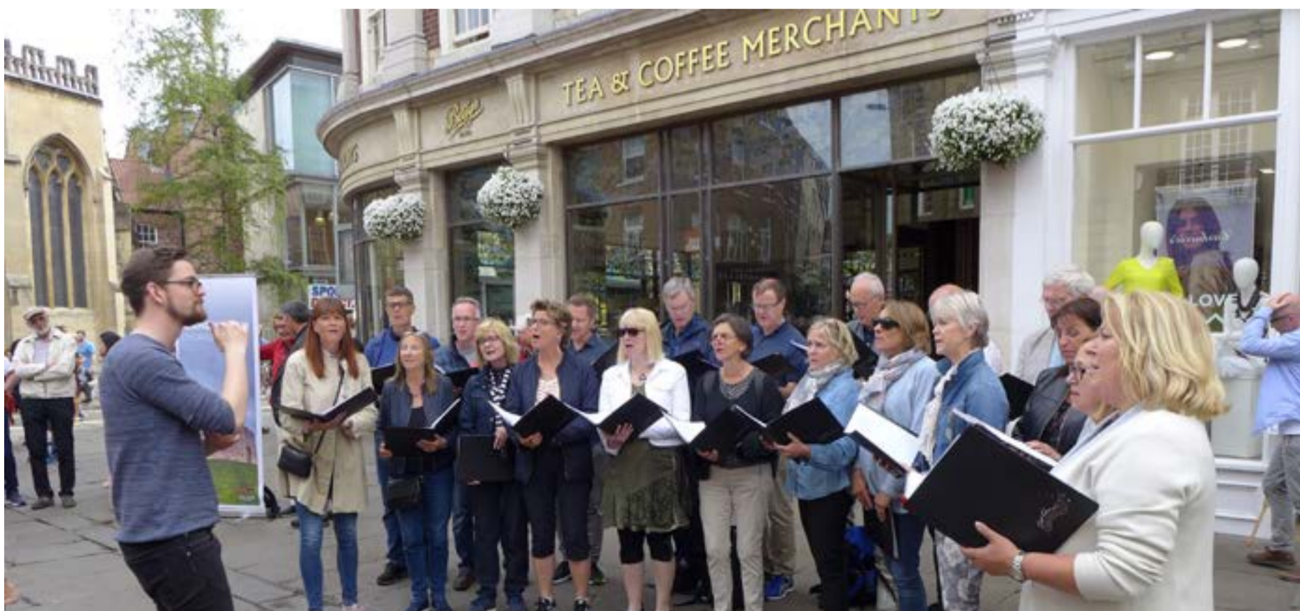
Utekonsert. York 2019.

Hjertelig velkommen til Jubileumskonsert i Bekkelaget kirke torsdag 14. november!