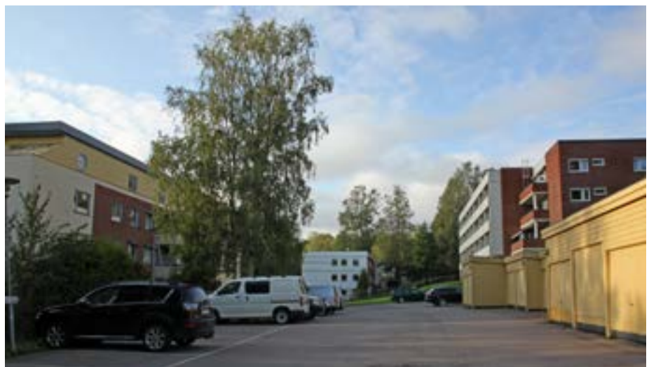
Her ser vi nordover mot blokkene Erlandstuveien 33 og 37 som menigheten eier. Helt til venstre Sandstuveien 16 med seniorboliger.

mens menigheten ved BOSE (Bekkelaget og Ormøy Sogn Eiendom AS) ser for seg at man setter opp ca 100 nye boenheter i tillegg til dagens boliger. Det vil da komme opp i totalt rundt 175 enheter. Dette vil bli en blanding av utleieboliger og det som kalles Omsorg+ (boliger for personer som ikke trenger å bo på sykehjem, samtidig som de ikke klarer seg alene uten mye hjelp).