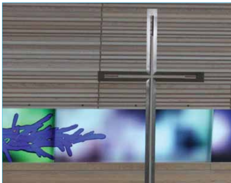
For noen er den kristne tro alt annet enn frihet. For andre er den nettopp frihet.

I dagens situasjon har vi høstet desillusjonerende erfaringer med vår nyvunne frihet og individuelle selvstendighet. Var det kanskje likevel ikke så enkelt å realisere et innhold å fylle friheten med? Pådro vi oss nye mentale belastninger i kjølvannet av de løste ufrihetsproblemene?