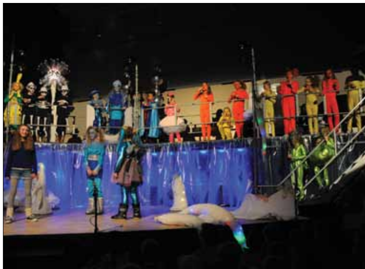
Fra en tidligere forestilling. Det er et imponerende arbeid som legges ned for å lage teater i konfirmantsalen.