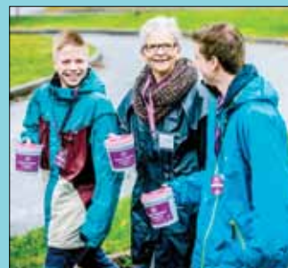
Bøssebærere for Kirkens Nødhjelp