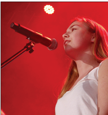
Flere lokale unge talenter opptrådte på scenen