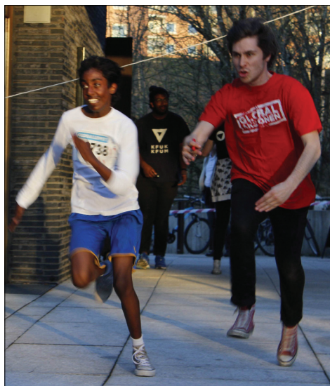
Hver runde ble registrert av ivrige sekunder.