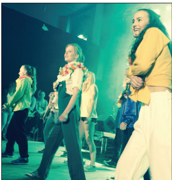
Østensjø barne- og ungdomsteater bidro med et utdrag fra jungelboken