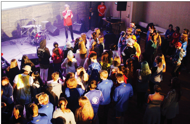
Etter løpet var det sceneprogram i konfirmantsalen.