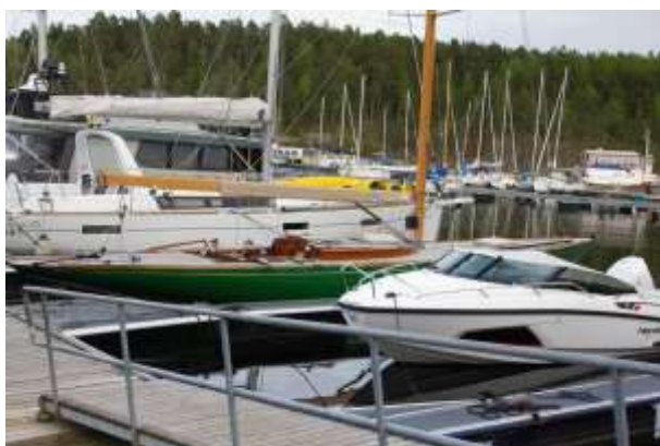
Eksklusivt miljø. Kongens båt— «Sira»