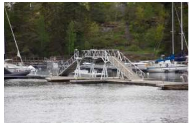
Dette er broen til Killingen i dag