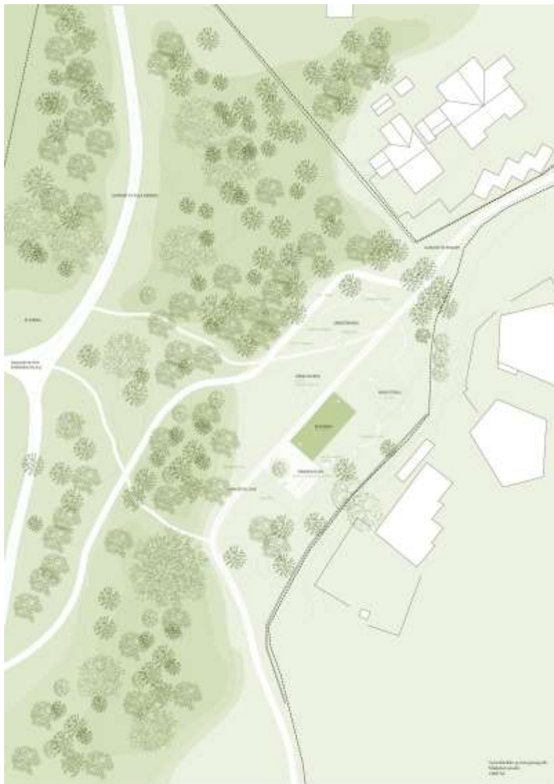
Illustrasjon : Hanna Haukøya/ Studio Gorilla