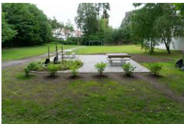
Slik ser området ut nå. Som man ser—det er en begynnelse

For å komme i mål med hele prosjektet, trenger vi også drahjelp lokalt. Vi trenger både dugnadshjelp og økonomisk støtte fra så vel stiftelser som privatpersoner og bedrifter.