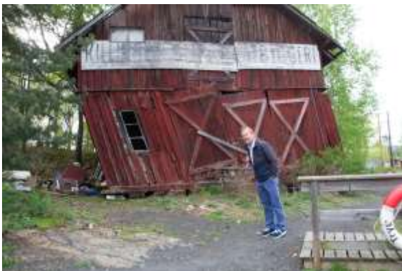
Det er ikke alle husene på Killingen som er i god stand

Så skal en betongbrygge (2) fjernes. Den er ikke byggemeldt. Dessuten er jo planen å oppgradere området.