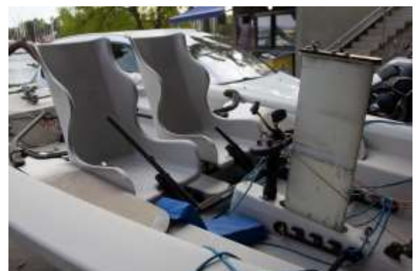
Sjøen skal være for alle. Dette er en seilbåt for handicappede