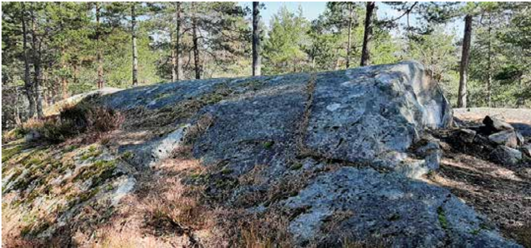
På vei over Grønliåsen fant vi dette rundsvaet der en turgåer har benyttet lesiden til å lage en liten bål plass. Støtsiden strekker seg langt bakover mot venstre.