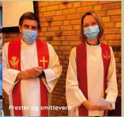
Prester og smittevern.