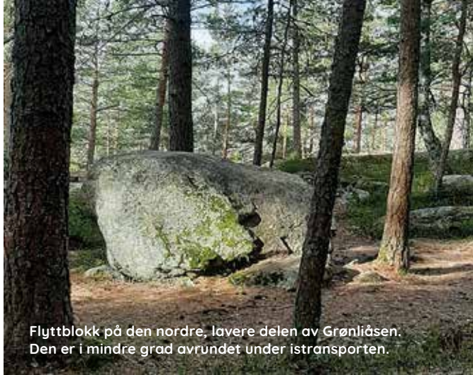
Flyttblokk på den nordre, lavere delen av Grønliåsen. Den er i mindre grad avrundet under istransporten.