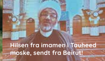
Hilsen fra imamen i Tauheed moske, sendt fra Beirut!