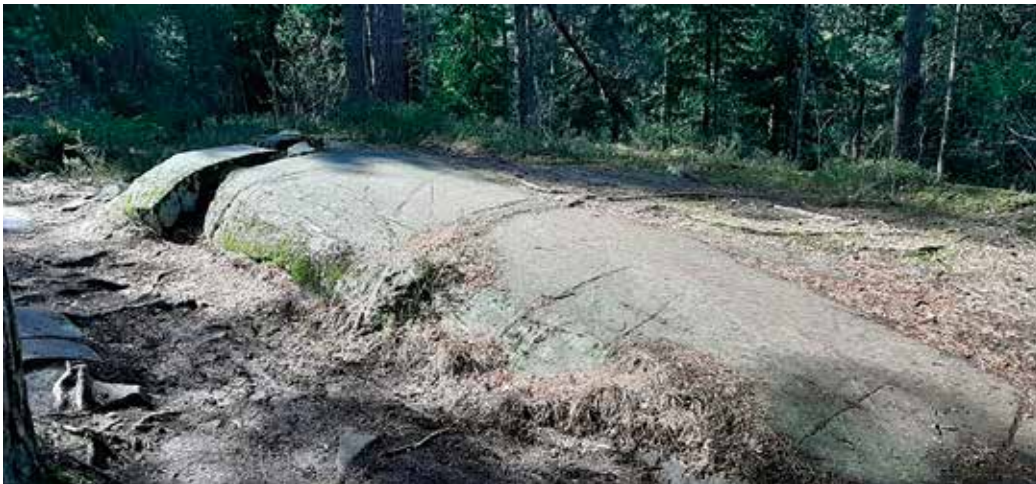
Et rundsva med støtsiden nærmest og lesiden bak. Her er en steinblokk løsnet i bakkant, men denne er ikke «plukket» av breen. Antagelig skjedde løsningen av blokken så sent under isavsmeltingen at breen ikke evnet å skyve blokken lenger vekk.