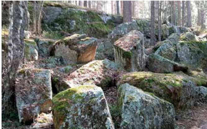
Steinblokker revet løs fra lesiden av et større rundsva. Både samlingen av mange nokså like blokker og liten påvirkning av iserosjon tyder på at de stammer fra et nærliggende rundsva.