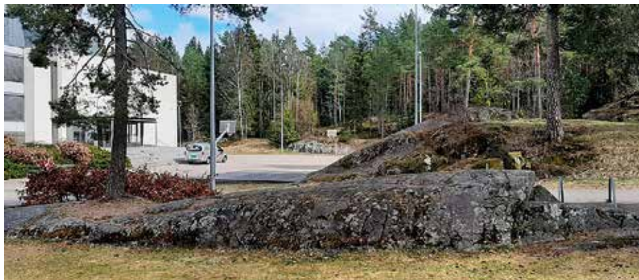
I sørenden av skolegården på Hauketo ungdomsskole har isen laget to fine rundsva med støtsider mot skolegården og lesider med brattkanter mot skogen til høyre.

Rundsva er en landskapsform som vi finner mye av i vårt område, både i de bebygde området og i Grønliåsen. Rundsva dannes under breer som beveger seg relativt raskt. Den er et eksempel på isens erosjon i «oppoverbakke» ved at den glir oppover rundsvaet på støtsiden, det vil siden som vender mot breens bevegelsesretning. Stein/grus/sand som ligger innefrosset i