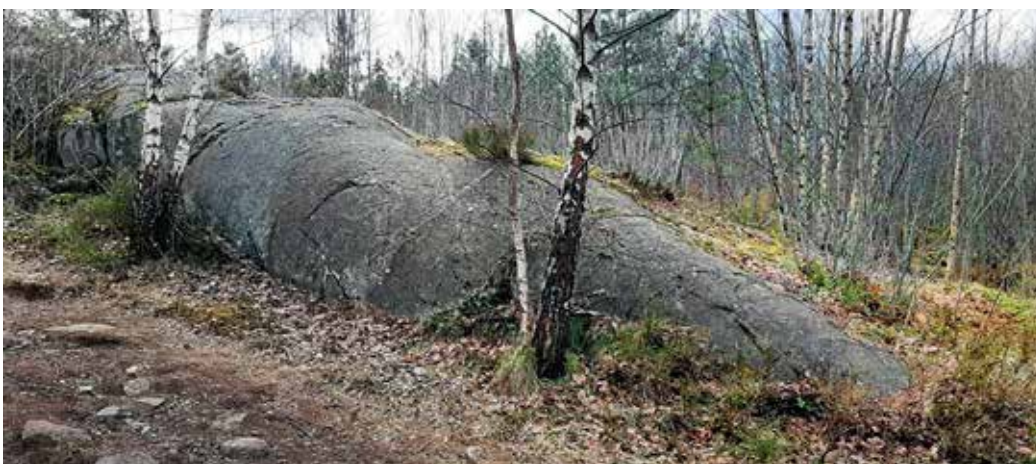
Her ser vi et rundsva med støtsiden foran på bildet; lesiden kan vi bare ane i bakkant. Dette er en rundsvaform som er nokså vanlig, og gir en god forklaring på at rundsva er gitt det folkelige navnet hvalskrottfjell.

bresålen, presser her mot fjellet under med høyt trykk. Prosessen kalles 'skuring' og tilsvarer effekten av sandpapir på treverk.