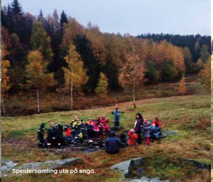
Speidersamling ute på enga.