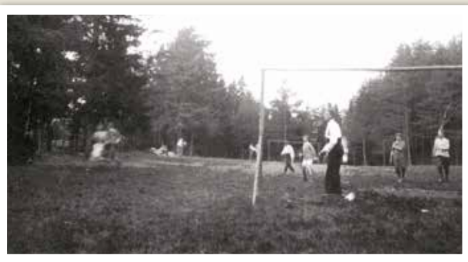
Her på Dalens fotball/idrettsbane ble den første kirken tatt opp i 1966.