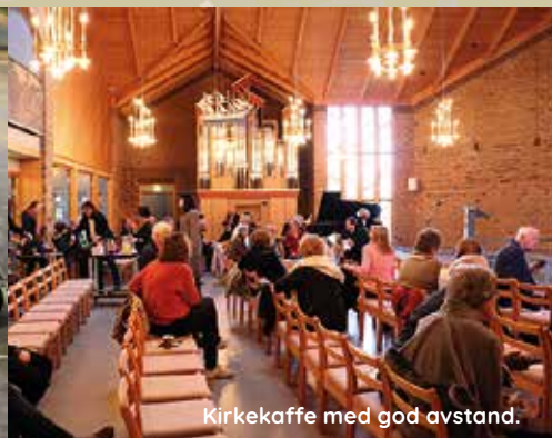
Kirkecaffe med god avstand.