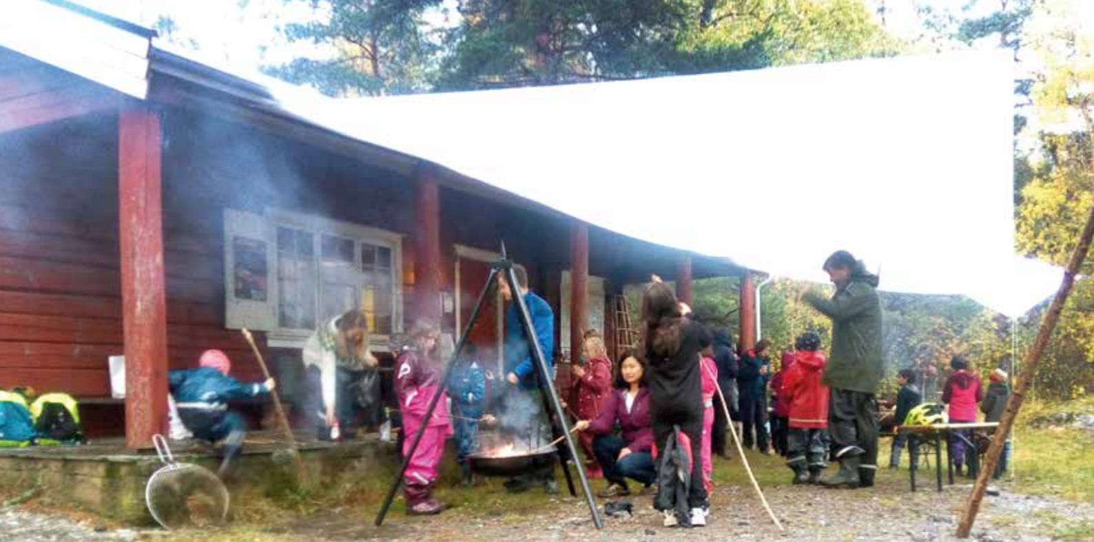
Samling rundt bålpannene ved Skytterhytta.