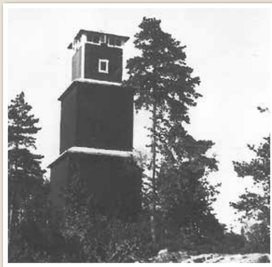
Fra toppen her skuet man langt, i 1933.