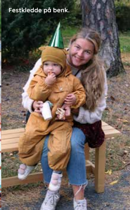
Festklede på benk.