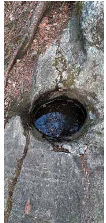
Jettegryta i Grønliåsen. Bildet til venstre har med noe mer av omgivelsene rundt og viser en liten, bratt skrent bakover på høyre siden av åpningen. På høyre bilde er skrenten bak blir mer utydlig. Jettegryta måler rundt 40 cm i diameter ved åpningen og er rundt 90 cm dyp. Bildene viser at vannet ikke fyller de øverste rundt 20 cm av jettegryta. Den har adskillig småstein og «rusk og rask» i bunnen, noe som gjør det vanskelig å gi et presist tall på dybden.

skaper strømhvirvler som drar med seg stein og grus og begynner å male seg ned i ujevnheter i berget dersom vannløpet blir liggende samme sted over en viss tid.