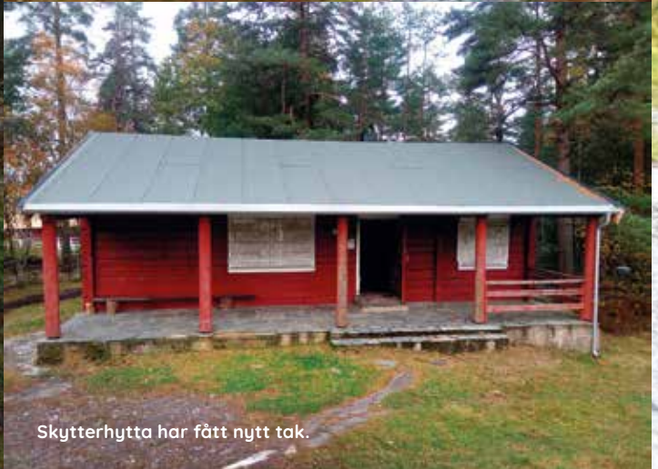
Skytterhytta har fått nytt tak.