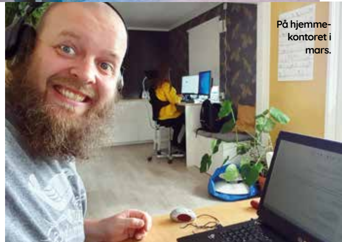
På hjemme-kontoret i mars.