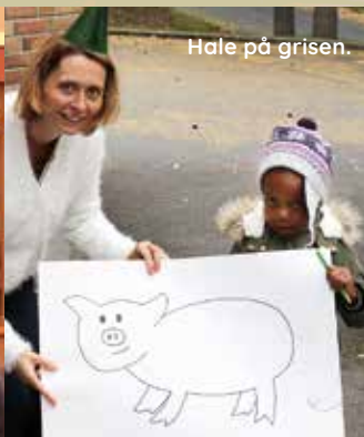
Hale på grisen.