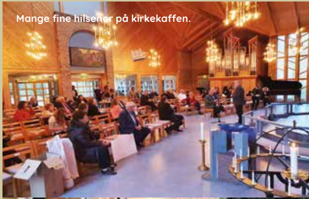
Mange fine hilserer på kirkecaffen.