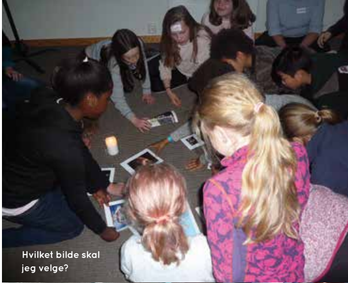
Hvilket bilde skal jeg velge?