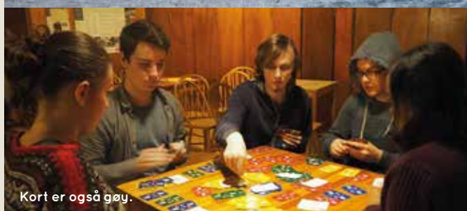
Kort er også gøy.

Hvis du blander kloke hoder, moro, peisprat, engasjement, bål, åpenhet for andre, latter, utedo og spillet ligrette sammen, så får du et glimt av medarbeiderweekenden vi dro på til Østmarks-kapellet. Tretti ungdomsmedarbeidere fra Holmlia og Hauketo-Prinsdal menigheter koste seg og kunne nyte tiden sammen den siste helgen i oktober. Vi brukte turen til å styrke og bygge fellesskapet og snakke om utfordringer vi møter i kontakt med de nye konfirmantene. Vi sluttet helgen med å lage gudstjenesten på Østmarkkapellet.