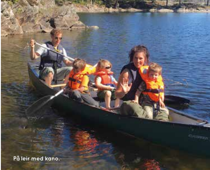
På leir med kano.