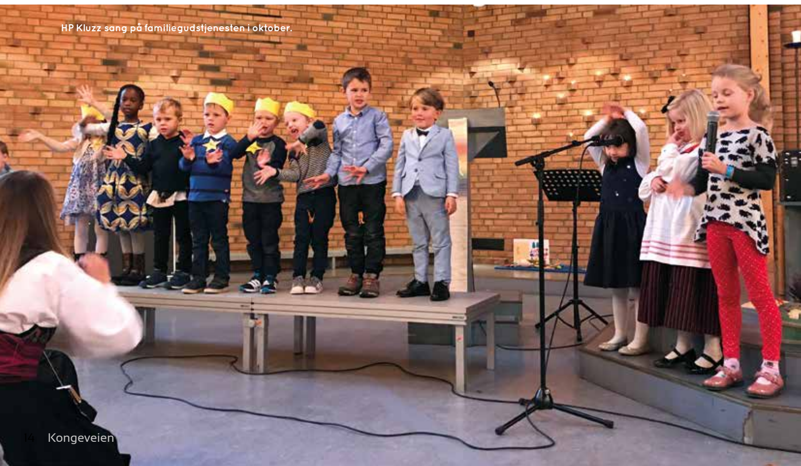
HP Kluzz sang på familiegudstjenesten i oktober.