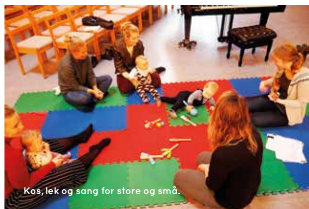
Kos, lek og sang for store og små.

TEKST: ÅSLAUG HEGSTAD LERVÅG