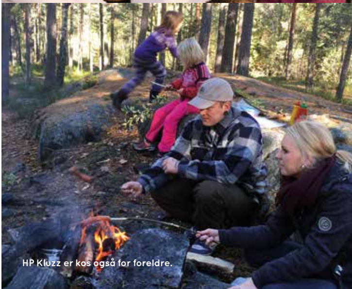
HP Kluzz er kos også for foreldre.