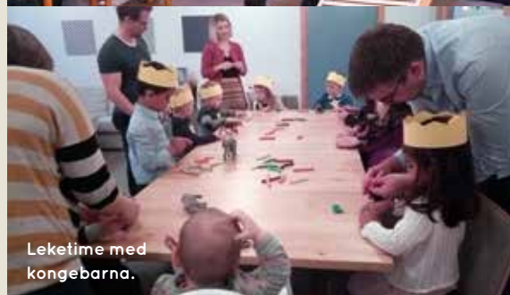
Leketime med kongebarna.

Du er et kongebarn -visste du det? Dette opplevde 4-åringene søndag 22. oktober under leketimen før familiegudstjenesten. De hørte hvordan Gud skapte verden fortalt med dyrestemmer, trommer og sprell og at de er skapt i Guds bilde som kongebarn. Derfor fikk alle en krone på hodet. Det ble godt tatt imot. Men hva ville en leketime om skapelsen vært om man ikke kunne skape selv? Da 4-åringene kunne lage et fantasidyr selv, ble det plutselig livlig i blant dem. Under gudstjenesten ble 4-års kirkebøker delt ut og HPkluzz sang for oss alle.