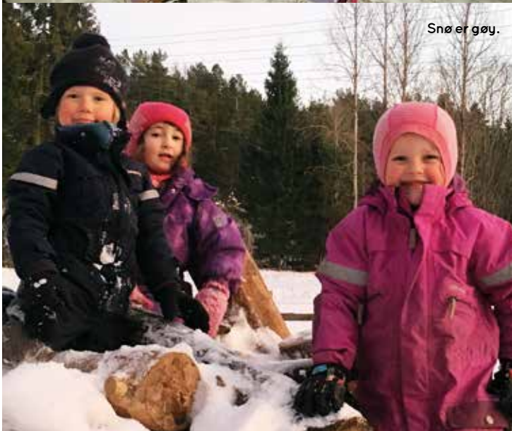
Snø er gøy.