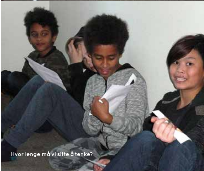
Hvor lenge må vi sitte å tenke?