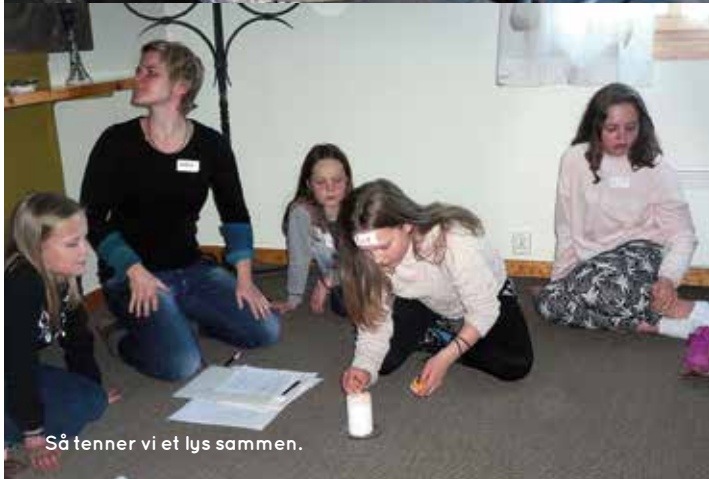
Så tenner vi et lys sammen.