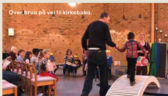
Over brua på vei til kirkeboka.