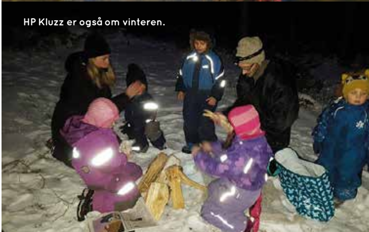
HP Kluzz er også om vinteren.