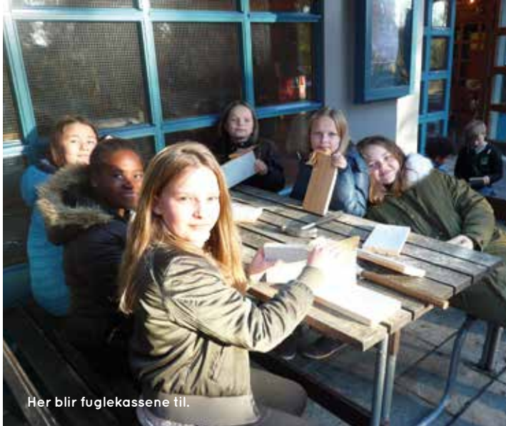
Her blir fuglekassene til.