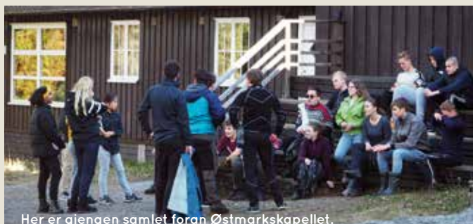
Her er gjengen samlet foran Østmarkskapellet.