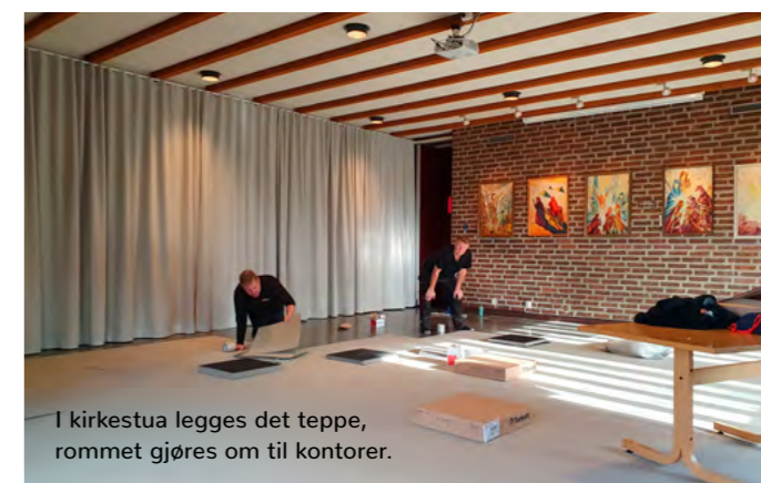
I kirkestua legges det teppe, rommet gjøres om til kontorer.

Gjennom denne midlertidige samlokaliseringen kan staben begynne å nyte fordelene av å være samlet, samtidig som planleggingen og rehabiliteringen av Fossum kirke fortsetter, med sikte på en langsiktig løsning som vil tjene både staben og menigheten.