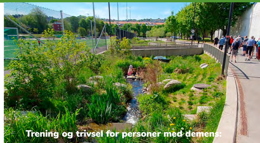
Trening og trivsel for personer med demens: