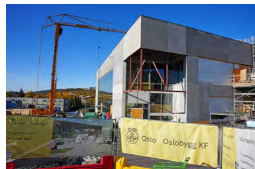
Lokalbefolkningen i hele Groruddalen ser frem til å kunne ta i bruk det nye badet på Stovner. Badet skal etter planen åpne i 2026.

Dette etterlengtede badeanlegget vil tilby fem bassenger, stupetårn, sklie, varme- og kaldkulp, samt garderobes, aktivitetssal, styrketreningsrom og en kafé med både inne- og uteplasser. Med alt fra et 25-meters basseng til boblebad og opplæringsbassenger, blir badet tilpasset både svømmeidrett, skoler og publikum i alle aldre.