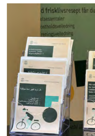
Frisklivssentralen holder til sammen med Rask Psykisk Helsehjelp på Stovner senter. Kom innom for informasjon på norsk eller andre språk.