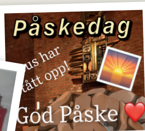
Snapchat-konto for ungdommen kom også på plass i denne perioden. Påsken ble godt dokumentert. @LambertKirkeUng (Hvis du ikke vet hva Snapchat er, er du ikke i målgruppen).