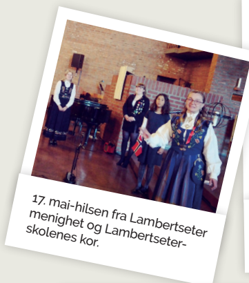
17. mai-hilsen fra Lambertseter menighet og Lambertseter-skolenes kor.