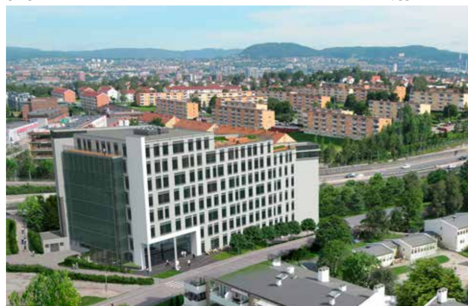
Slik skulle det bli i Byggveien 8, men Obos har ikke fått leid ut bygget, derfor er byggingen utsatt.