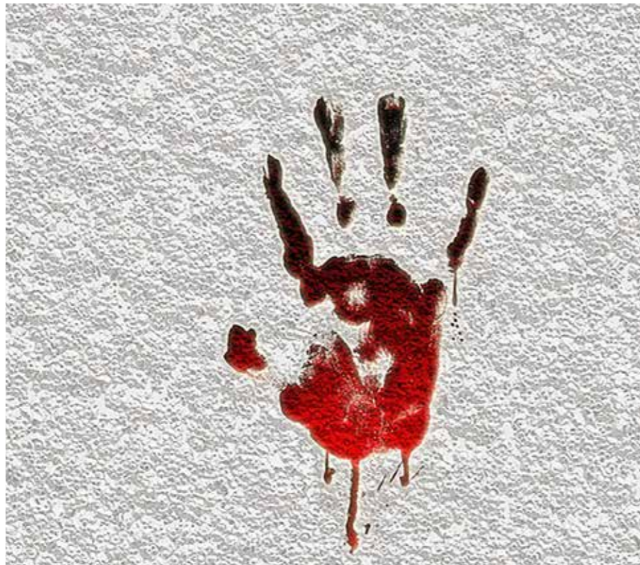
Påskens drama overgår enhver krim

Heldigvis forteller evangeliene også noe om dette. For akkurat som i krimlittera-