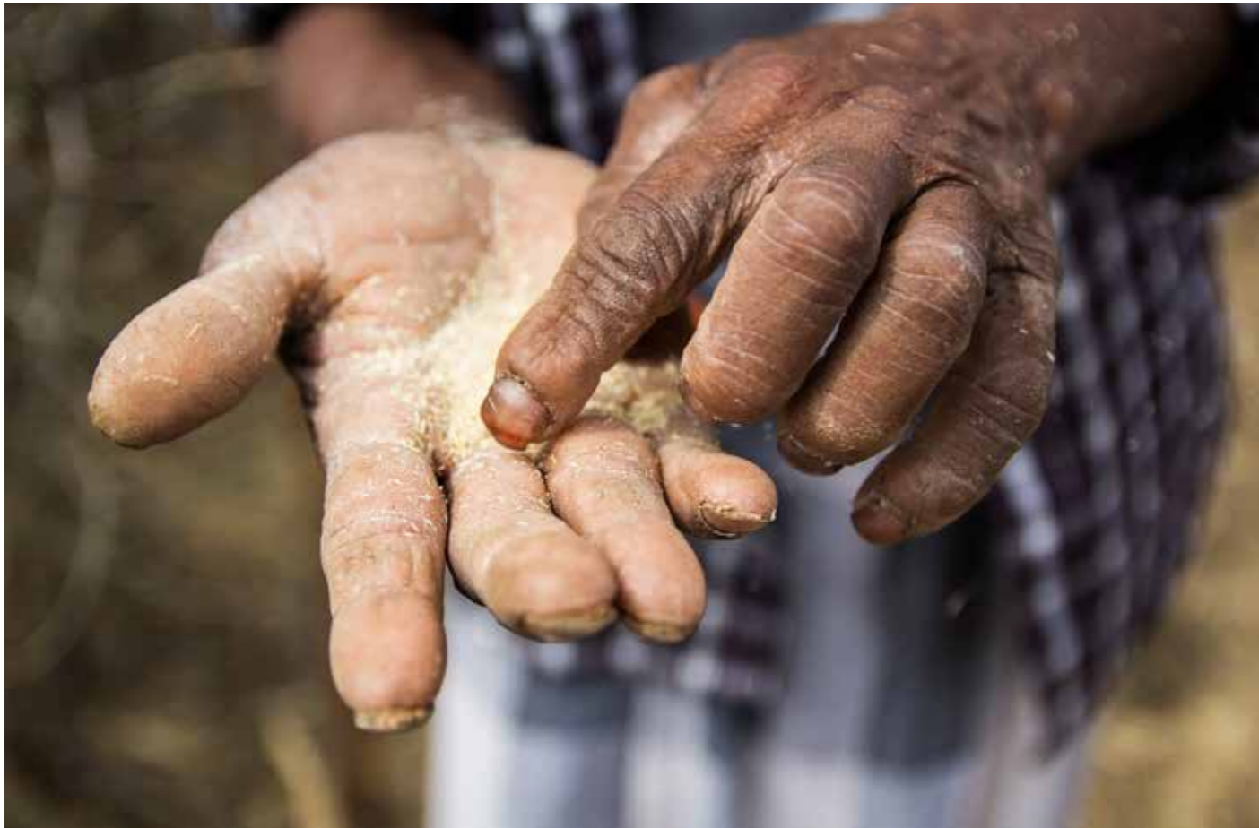
Den knusktørre jorda gjør det umulig å få avlinger som kan selges videre på markedet.

Aldri før har vi sett så mange store humanitære kriser på en gang. Kirkens Nødhjelp er i katastrofen med rent vann. Nå trenger de din hjelp.