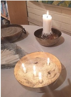
Også kirkestua kan få kirkepreg. Øverst: langfredag med kneleskamler, tildekket alter og fem røde roser. Under: et provisorisk, men mye brukt lystenningssted.