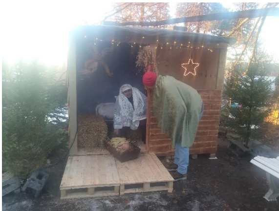
Øverst: stallen på plass utenfor kirka! Etter hvert kom det både halm, krybbe og Jesus-barn i krybben.