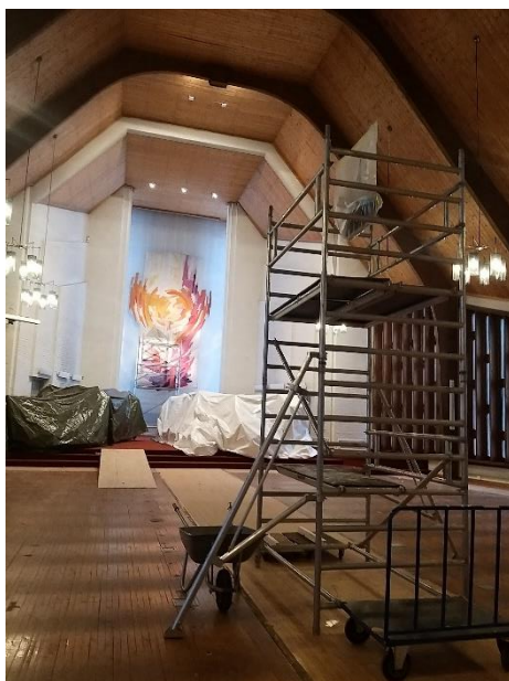
Over: Menighetens barnehage hadde sin julegudstjeneste med julespill ute foran og i krybben. Her er en av de vise menn som lurer på om stjernen har ledet ham til riktig sted, og om det virkelig er en konge som ligger i krybben.