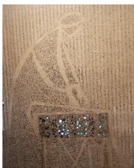
Nedenfor: Fra Bakkehaugen kirke med sin særegne kunst i betongen.

registrerte seg når de kom, brukte antibac og holdt avstand, og at de satte seg på anvist plass.