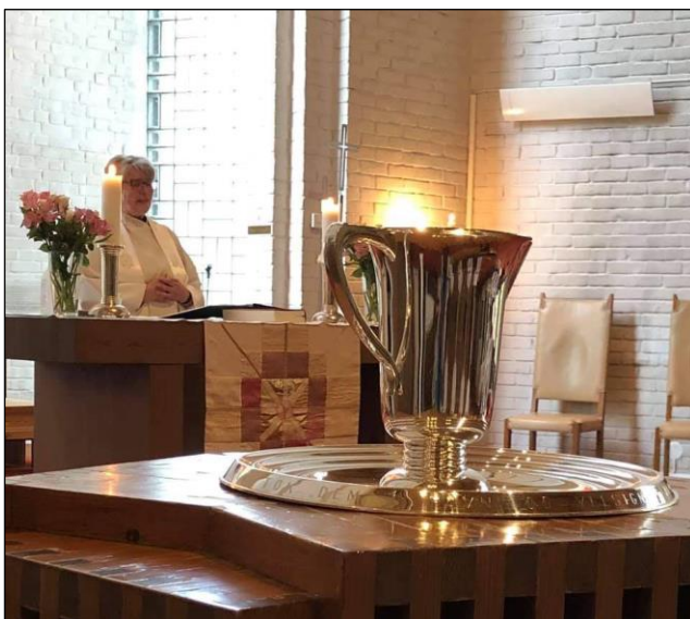
Noen søndager kunne det bli flere korte dåpsgudstjenester etter hverandre. Like stor stas er det hver gang!

I 2021 har det fortsatt vært mange avlysninger og utsettelse av dåp. For mange er det å kunne samle faddere, familie og venner en viktig del av dåpen og feiringen av livet. Imidlertid har noen satt pris på muligheten til å ha en enkelt dåpsgudstjeneste med bare de aller nærmeste til stede. Flere av soknets dåp har vært i egne dåpsgudstjenester i Maridalen kirke, som av mange oppleves som å være «nesten hjemme».