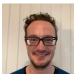
Eivind Vonen Kantor

Flere av instrumentene bærer preg av slitasje på grunn av stor bruk. På grunn av den økonomiske situasjonen lokalt og sentralt er det ikke planlagt oppgradering av instrumentparken.