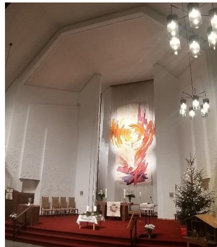
Til høyre: Slik tok en delvis nyoppusset kirke imot dem som kom julaften og juledag. For mange var dette første gjensyn med kirka på over ett år.