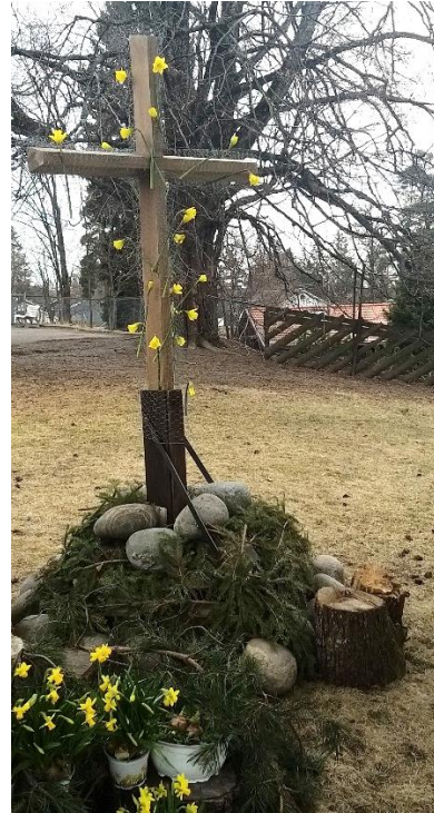
Til høyre: Påkehagen kom opp også i 2021. Påskedag kom mange og festet påskeliljer på korset og hørte påskemusikk fra tårnet.