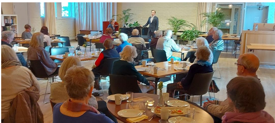
Godt program er viktig på tirsdagslunsjen