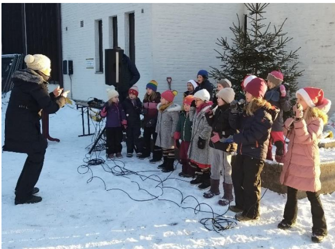
Til venstre: En gruppe fra BAGO synger gleden og jula inn på kirkeplassen julaften 2021.