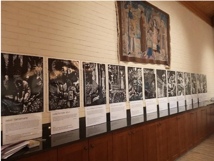
Over, til venstre: «Korsveien», som før hang inne i kirka i fastetiden fram til påskedag, var i 2020 hengt opp ute på kirkeplassen. I 2021 ble «Korsveien» flyttet inn i kirkestua, ettersom kirkeplassen var fylt opp av byggerigger og materialer.