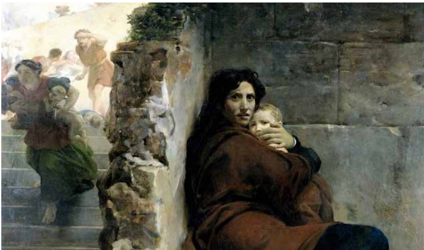
Kong Herodes jaktet på alle guttebarn under to år etter Jesus var født. I redsel for ryktet om en ny konge som kunne true hans posisjon. Massacre des Innocents . Léon Cogniet. Malt i 1824. Musée des Beaux-Arts, Rennes