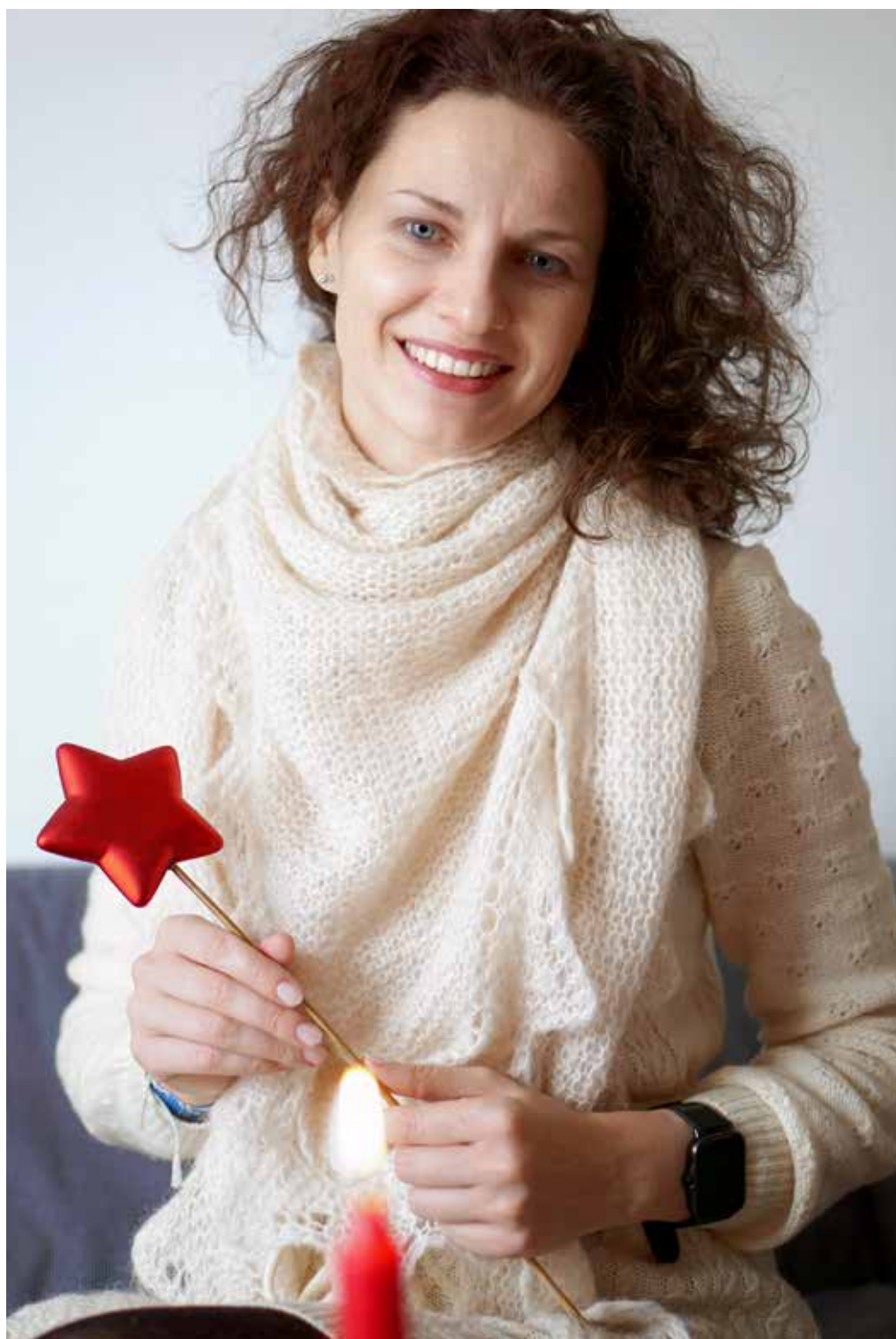
Å tenne lys er felles tradisjon i både norsk og ukrainsk julefeiring.