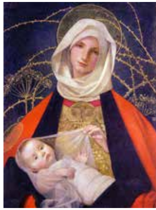
Madonna and child. Marianne Stokes 1905.

Boka inneholder 24 korte kapitler om juleevangeliet, om personene i og rundt krybben og om Jesusbarnet i sentrum.