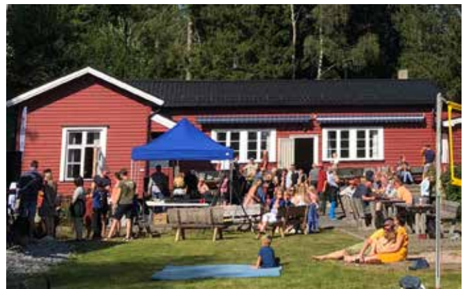
Velhuset på Sørbråten har fremdeles en flott, samlende funksjon.