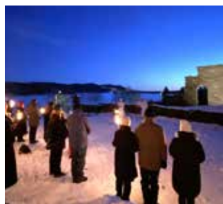
Gudstjeneste i Maridals- ruinene er blitt tradisjon s.30