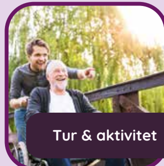
Tur &amp; aktivitet

Fast avtale eller hjelp når det er behov - alt ettersom hva som passer deg best.