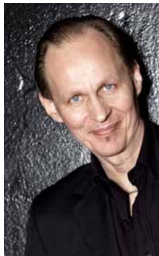
Forfatter Mikael Niemi

Romanens to hovedfigurer er prosten og det samiske