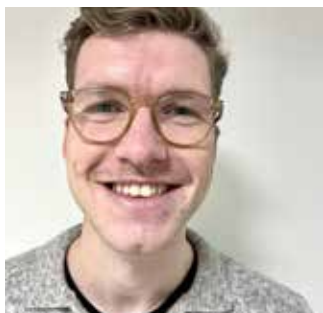
Mørkredd sokneprest - kommer seg med årene s.32