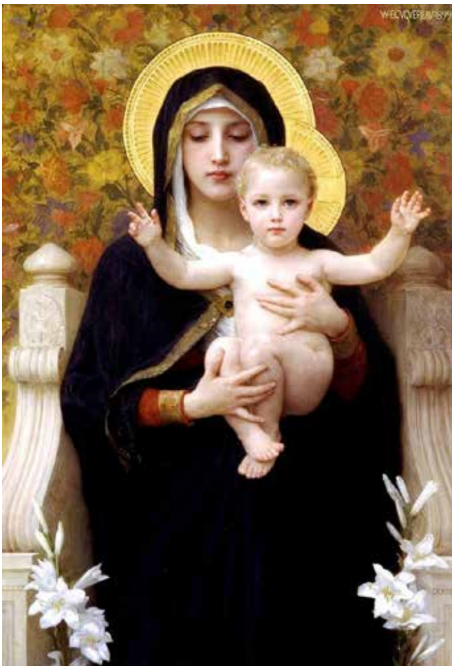
The Madonna of the Lilies. William Adolphe Bouguereau. 1899.

Det skjedde ikke i Betlehem mens Kvirinius var landshøvding i Syria det var i et lite blåmalt svært alminnelig rom en seng et bord og en hvit stol det var ingen hyrder eller engler men en tynn lysstråle trengte gjennom huden og ribbenene og inn i hjertet