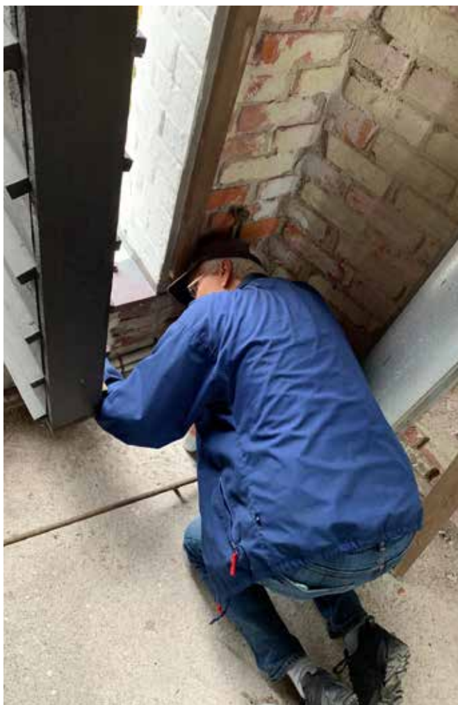
Ingen oppgave for stor - ingen for liten for vaktmestergutta. Uten dem hadde kirken ofte vært i trøbbel på det praktiske plan.