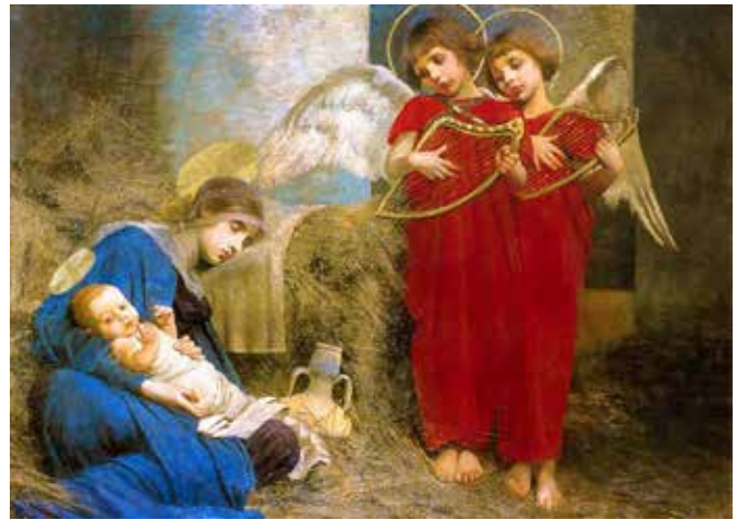
Angles entertaining the Holy Child. Marianne Stokes 1893.