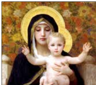
Juleevangeliet - det vakreste som er skrevet? s. 14