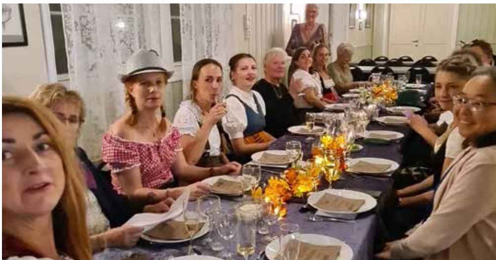
Oktoberfesten i år ble tatt hånd om av yngre småbarnsmødre. Alle koste seg.

Og kvinnene har ikke ligget på latsiden når det gjelder beboernes beste.