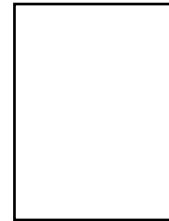
Nordberg menighetsråd Ny leder ikke valgt ennå når bladet går i trykken.