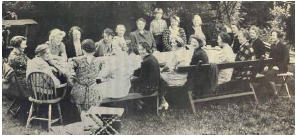
Sørbråten Kvinneforening ble stiftet sommeren 1942. Bildet er tatt i hagen hos Simonsen (Sørhellinga).

I 1948 startet foreningen med juletreff for barn.