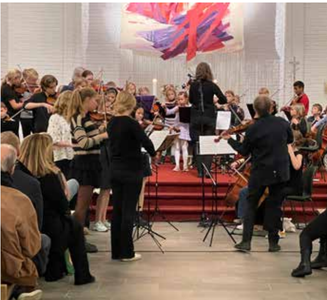
Strykeorkesteret sjarmerte alle med sitt flotte spill på tirsdagens storkonsert.