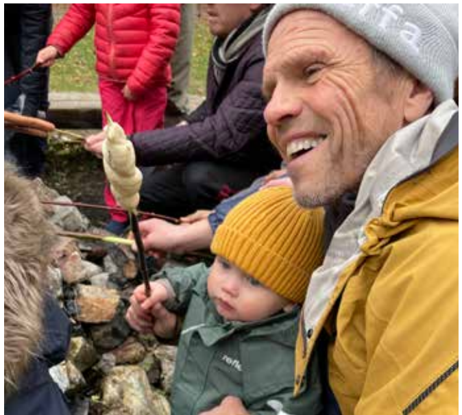
Livets første pinnebrød på speidernes arrangement lørdag.