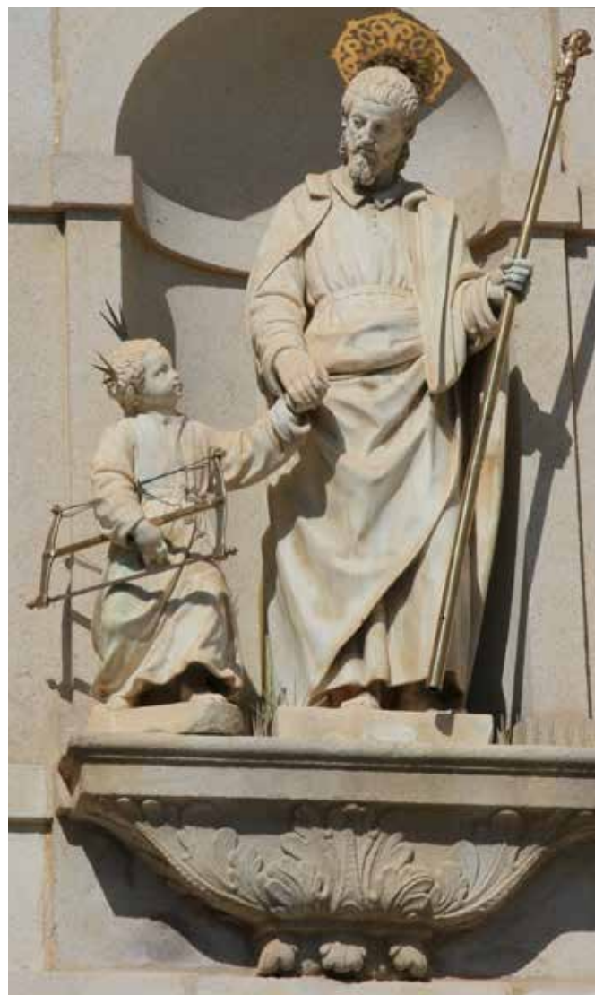
Jesus og pappa Josef. Skulptur på fasaden av Sankt Josefskirken i Avila i Spania.