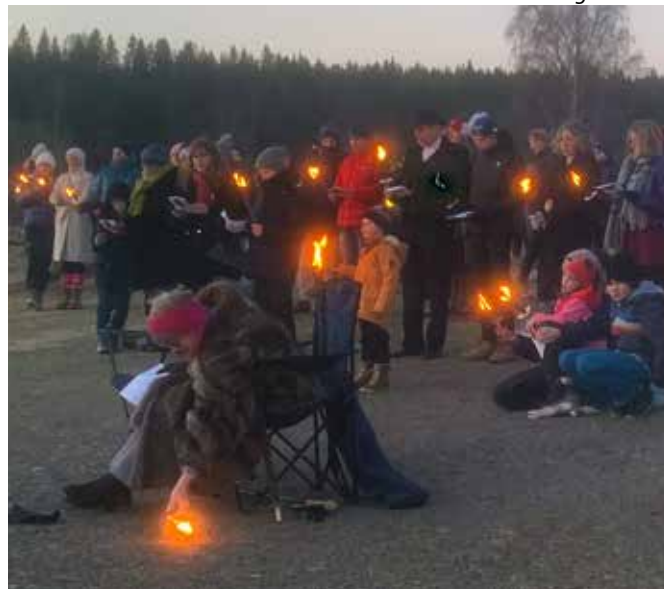
Lysene er tilbake i kirkeruinen på julaften