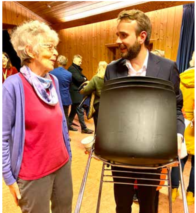
Næringsminister Vestre holdt et engasjert innlegg på debattkvelden mandag. Og etterpå bar han stoler og slo av en prat.