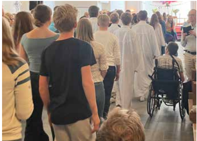
Mulig å etteranmelde seg til konfirmasjon. Konfirmasjonstiden starter etter jul.

Noe av det som er ekstra gøy med å være konfirmant i Nordberg er å dra på leir. I 2023 skal vi delta på KonfAction Bø, en stor leir for konfirmanter fra