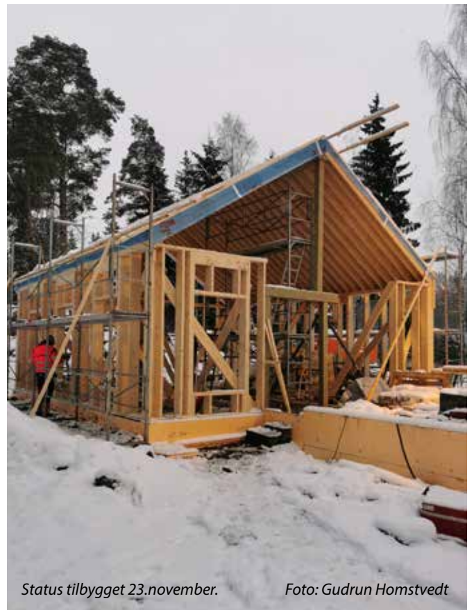
Status tilbygget 23.november.