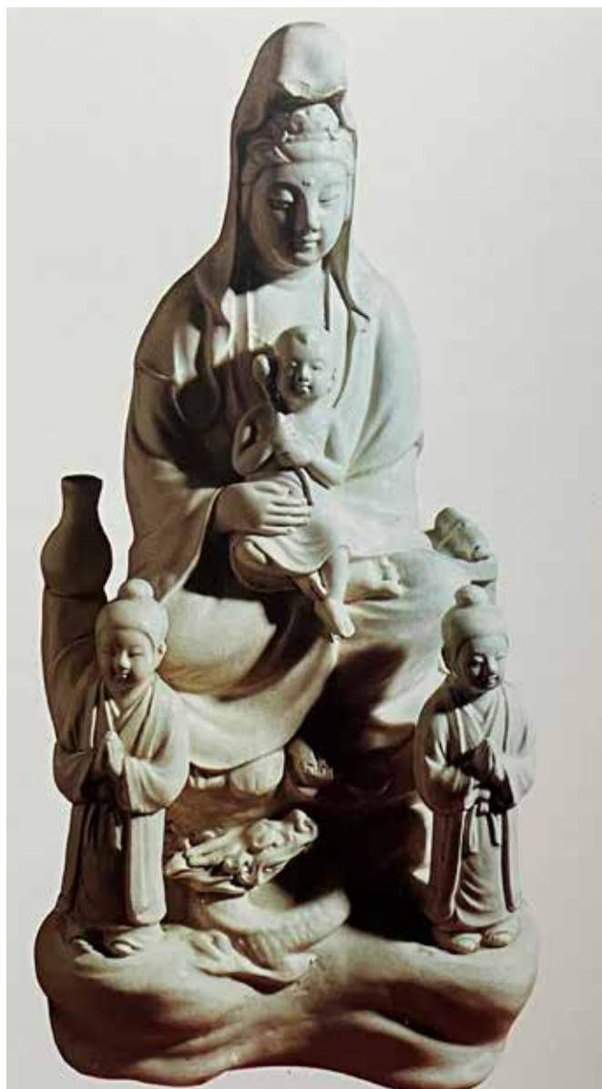
Da kristendommen ble forbudt i Japan på 1600-tallet, skjulte de kristne sine bilder inni buddhastatuer, eller de fremstilte Maria og Jesusbarnet som bilder av barmhjertighetens gudinne, omtalt som Kannon.