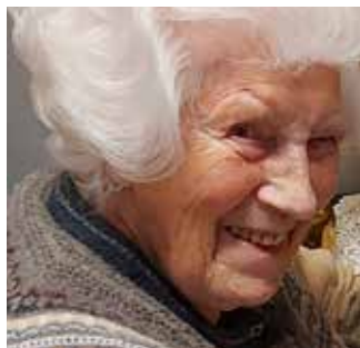
Når unge møter eldre blir det trivelig! s. 11