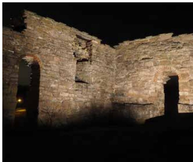
Når lys tennes i kirkeruinen på julaften, vekkes en gammel skikk til live.

Folk tok vare på lysstumpene og brukte dem når