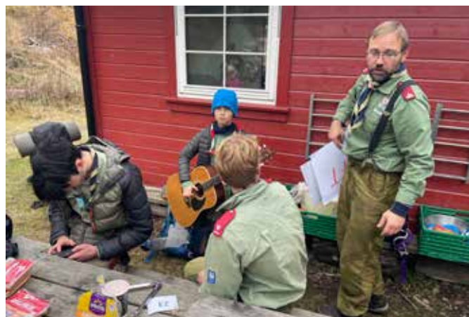
Speiderne lagde en flott "speiderleir" på Koll-banen lørdag.