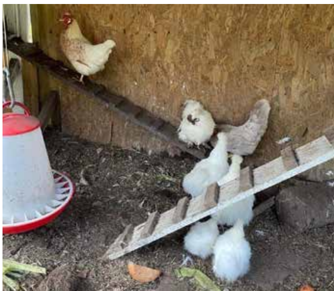
Fluffy, myke silkehøner deler gjerne hus med andre raser som på bildet. Til venstre sees en forautomat. Vi er blitt faste kunder på Felleskjøpet.

kelt ut fra hennes personlighet mens jeg betrakter dem i stillhet og lar hodet tømmes for tanker. Jo, jeg har jeg blitt glad i hønene mine. Og jeg er temmelig overbevist om at det samme gjelder for alle med høns i hagen.