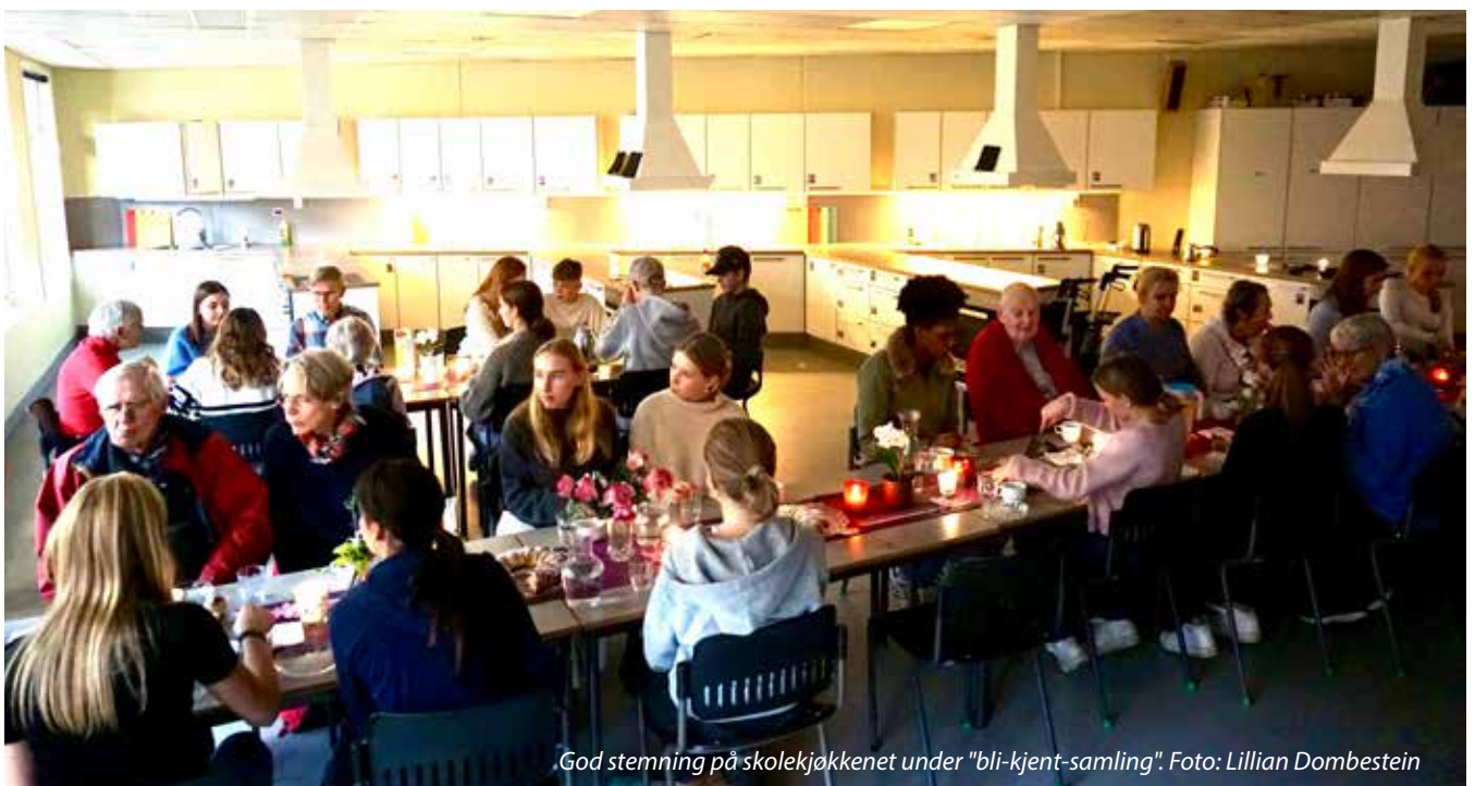
God stemning på skolekjøkkenet under "bli-kjent-samling".