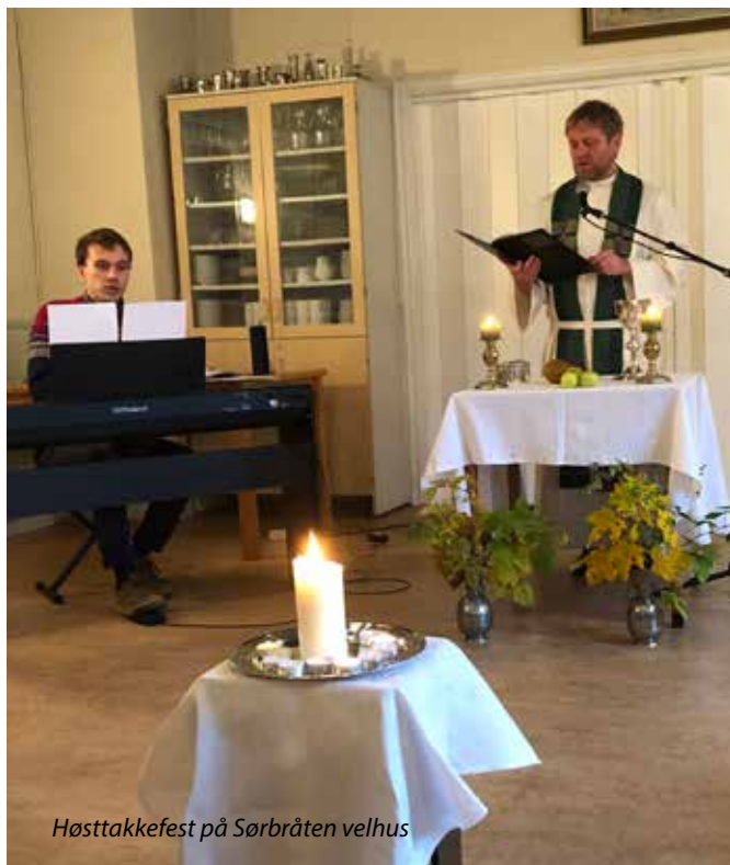
Høsttakkefest på Sørbråten velhus

Vipps Kirkestue Maridalen Vippsnr. 747093