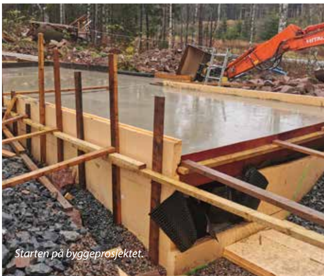
Starten på byggeprosjektet.

Kirka et stengt en periode, men det stopper ikke gudstjenestene.