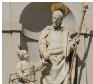
Er Josef selve helten i julefortellingen? s. 32