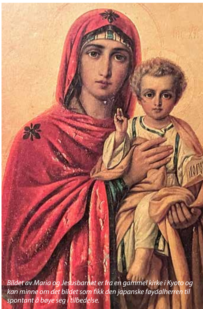
Bildet av Maria og Jesusbarnet er fra en gammel kirke i Kyoto og kan minne om det bildet som fikk den japanske føydalherren til spontant å bøye seg i tilbedelse.

I begynnelsen vokste da også kirken raskt.