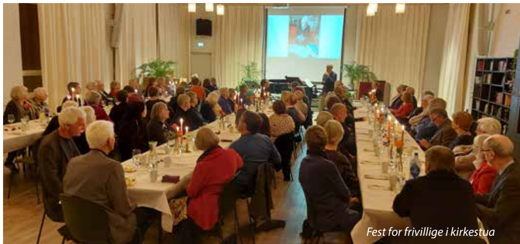
Fest for frivillige i kirkestua

Egentlig er 60 år ikke et stort jubileum. De færreste sentrale redaksjoner legger vekt på et slikt tall. Men så viser det seg likevel at folk fra Gaustad, Nordberg og Korsvoll strømmet til feiringen av kirkebygningen som har stått her i Kringsjågrenda gjennom 60 år.