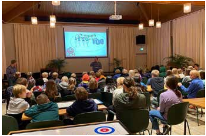
Z-Nordberg feiret med gamle og nye deltakere på fredag.