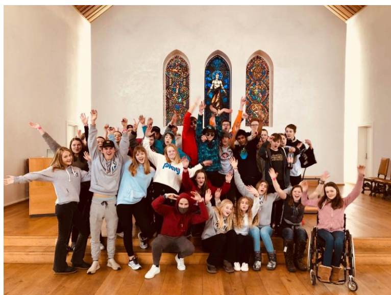
Deltakere på Lys Våken PLUSS – overnatting i kirka for ungdom!

Vi er heldige og har mange frivillige ungdomsledere som stiller opp frivillige på flere trosopplæringstiltak. Men vi må jobbe med å rekruttere foreldre/voksne.