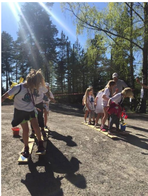
Bilde fra Tårnagent helg!

Fra torsdag til lørdag i vinterferien inviteres alle fjorårskonfirmanter til overnatting og festival i kirken. Vi leker sammen, spiller spill, spiser god mat, hadde undervisning/samtale om det å være kirke og tro. Vi hadde bønnevadring og kveldsavslutning. Kveldene ble avsluttet med nattkino. Trosopplæringen og ungdomsarbeidet samarbeider om dette. Til sammen var vi 29 ungdommer.