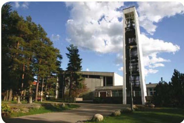
De tre kirkeklokkene er på henholdsvis 850, 480 og 240 kilo, og er støpt hos Olsen Nauen & Sønns klokkestøperi

På ett område har kirken vært banebryter. Det gjelder tilrettelegging for tunghørte med høreanlegg. For kirken var det viktig at Ordet nådde ut.