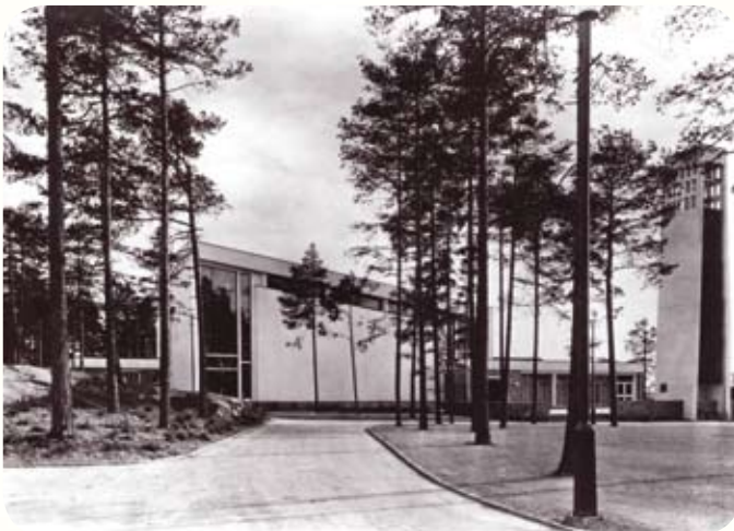
Kirkens arkitekter var Helge W. Simers og H. Chr. Gaaserud

En annen faktor som gjorde oppgaven vanskelig, var kommunens manglende forpliktelse til å finansiere andre rom enn kirkerommet med birom. Dette ga en særnorsk utforming av kirkebyggene, hvor en del av kirkerommet ble atskilt til menighetssal(er). Når menighetssalene var knyttet til hovedrommet fikk man antall lovpålagte sitteplasser. Hvor god forbindelse det var mellom det liturgisk møblerte hovedrommet og salen(e) som kunne legges til, var helt avhengig av det arkitektoniske hovedgrepet.