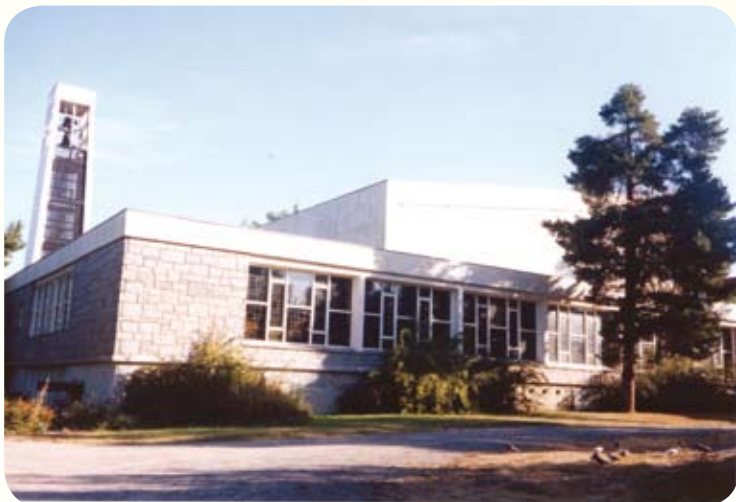
Kirken er bygget for 400 plasser i kirkerommet, som kan utvides med omlag 200 plasser i tilstøtende menighetssal

I Jar kirke er det høye saltaket fra den tradisjonelle kirkeformen beholdt. Det markerer selve kirkerommet. De andre rommene er lagt i en tilsluttende fløy som danner et tun. I Tonsen kirke har det store saltaket en fortsettelse på den ene siden og dekker to menighetssaler. Taket er derfor vesentlig slakere. Bygget mister dermed noe av den spensten som Jar kirke har. Menighets-salen i Tonsen kirke kan åpnes mot kirkens langvegg. I Oppsal kirke har arkitekten stilt seg mye friere i forhold til utseende til det tradisjonelle kirkebygget. Det er satt sammen av ulike funksjonselementer til en komposisjon.