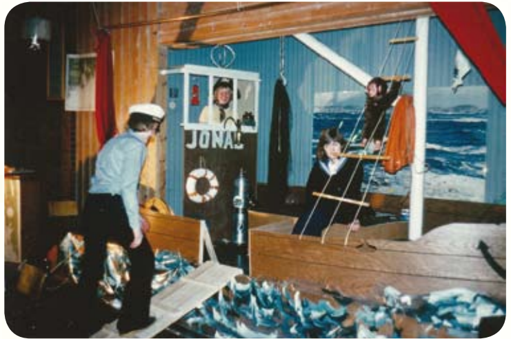
I 1974 ble forestillingen "Alle mann over bord" arrangert i lillesalen i Oppsal kirke

hvor er de da? De får sjelden ta med seg kamerater hjem. Kirken har ansvar for alle ungdommene. Klubben har det for trangt. Det er ikke å bygge - men å drive en storstue på Oppsal som blir den store utfordringen. Målet er å lede ungdommen til Kristus."