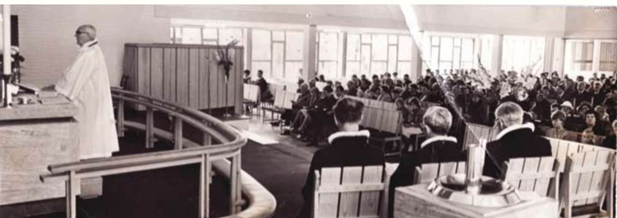
Biskop Johannes Smemo foretter under vigslingsgudstjenesten 22. oktober 1961