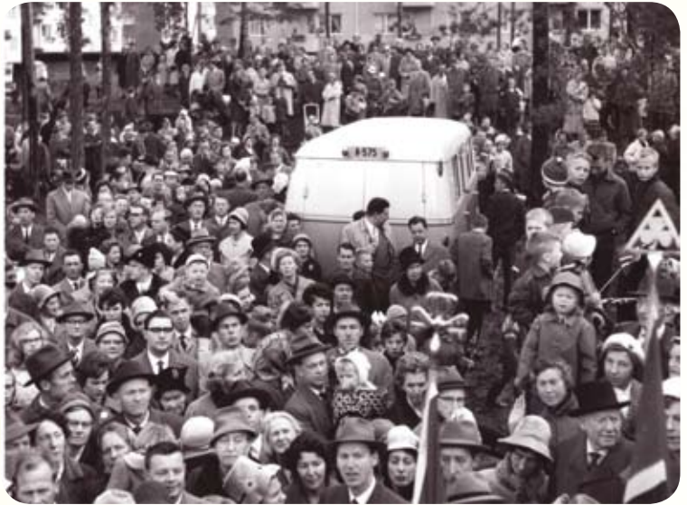
Det var et meget stort oppmøte til kirkens vigslingsgudstjeneste

man møtt med velvilje. En av Norges største menigheter ville vokse opp her. Et menighetsråd ble valgt og det satte hjulene i gang.