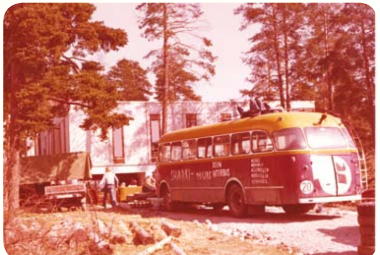
Loppemarked til inntekt for ungdomsklubben i 1975