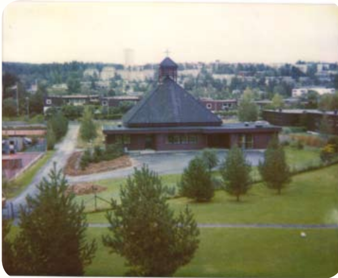
Bilde fra 1980-tallet. Tomten ble utskilt fra den nærliggende Søndre Skøyen gård, og bygget er plassert sentralt i et boligområde

Svært mange av de fastboende føler tilhørighet til kapellet og velger kapellet som ramme rundt merkedager i familiens liv og kommer til gudstjeneste ved de store høytidene.