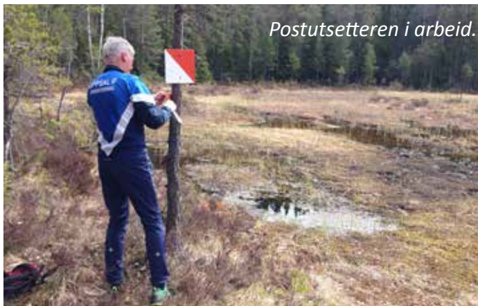
Postutsetteren i arbeid.

Visste du at Oppsal Orientering i 50 år har arrangert turorientering i Østmarka? Ola Dilt hadde sin åpningsdag ved Ulsrudvannet Kristi himmelfartsdag 1967. Og er fortsatt i full fart! Turorientering gir folk flest tilbud om å komme ut i skogen, også utenfor de faste stiene. Har du lyst å prøve turorientering? Det er fortsatt ikke for sent å bli med på å finne denne sommerens poster!