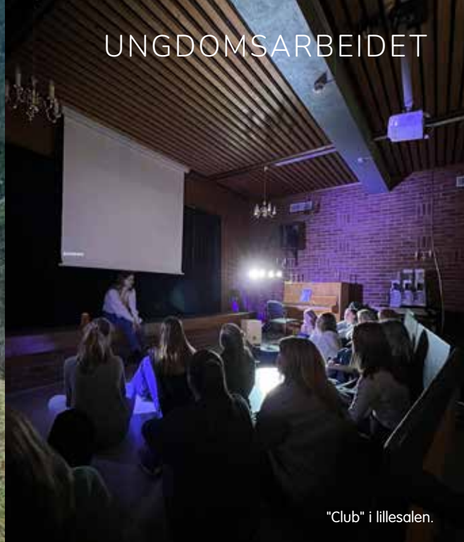
"Club" i lillesalen.