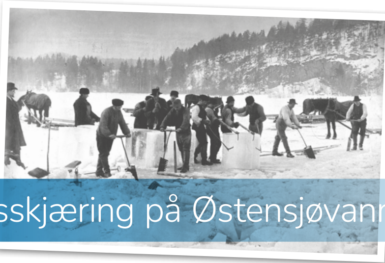
Isskjæring på Østensjøvannet i 1901.