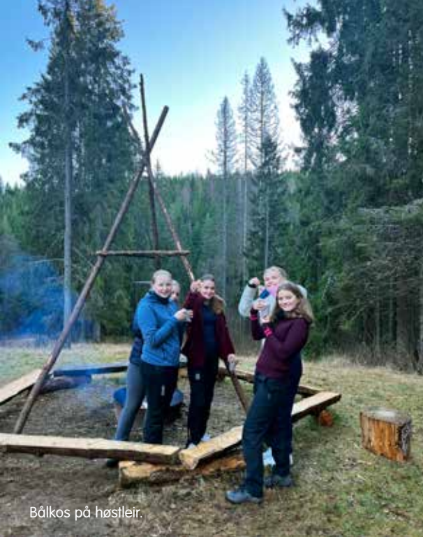
Bålkos på høstleir.