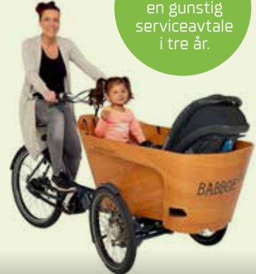
Laste-sykler fra Babboe.

Alle sykler selges med en gunstig serviceavtale i tre år.