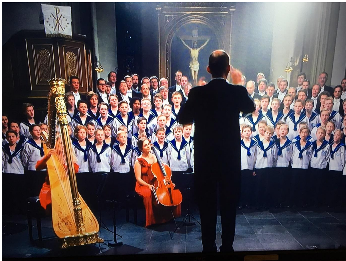
Paulus og Sofienberg menighet