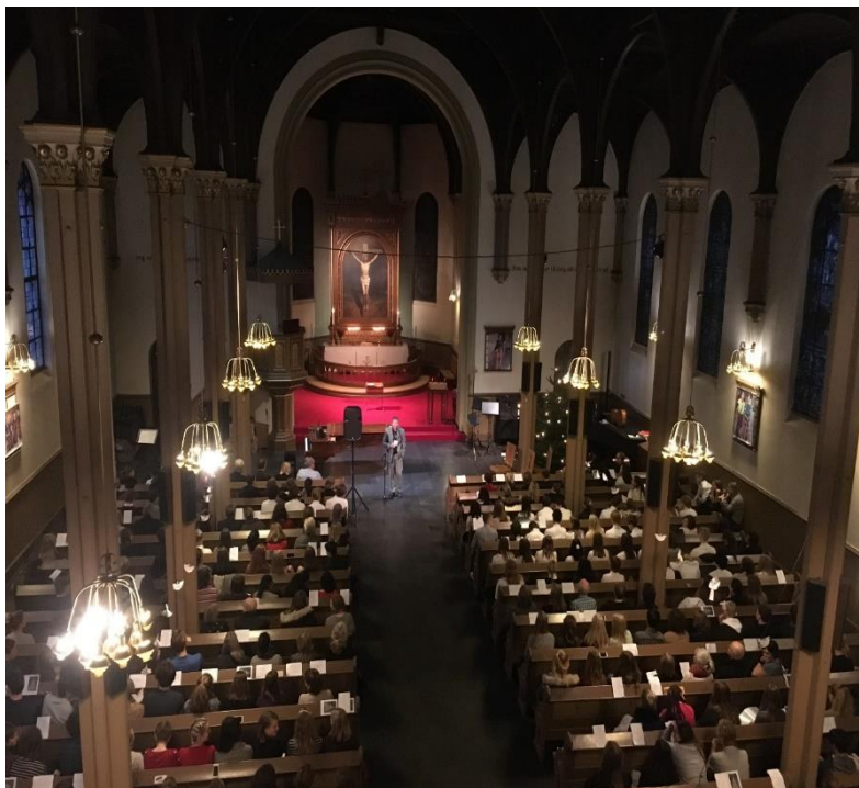
Full kirke med Foss vgs. på juleavslutning