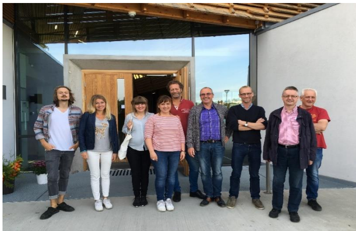
Staben var på besøk i Son kulturkirke SAGA i september.