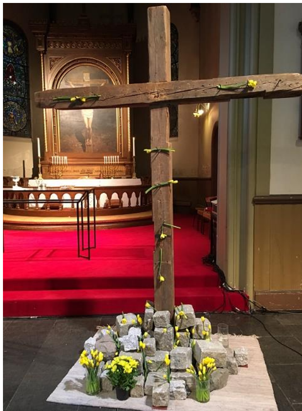
1.påskedagsfeiring i Sofienberg kirke

I tillegg var det 42 gudstjenester utenom søn- og helligdager. Disse ble forrettet fra Paulus sykehjem, Dagavdelingen ved Sofienberghjemmet, Pusterommet og Taizé-samlinger. Paulus og Sofienberg menighet har et rikt kirkemusikalsk liv, og dette preger også gudstjenestefeiringen. Både Paulikor og Sofienbergkoret deltar jevnlig under gudstjenesten, enten med en forsangergruppe, eller med hele koret.