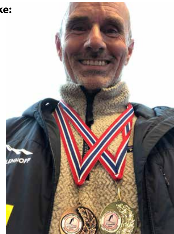
Det konkurreres aktivt som veteran-skihopper. Her er han avbildet med gullmedalje fra K40 og bronse K60, begge fra veteran-VM. Det er for øvrig også veteran-VM i Midstuen til høsten, som han også planlegger å delta på.