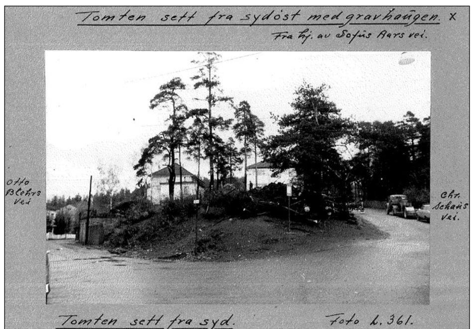
Fra notat av Louis Smedstad.