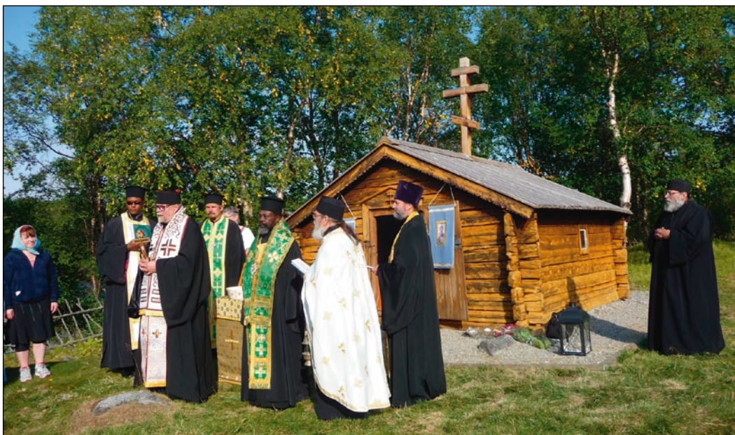
Ortodoks gudstjeneste ved St. Georgs kapell.