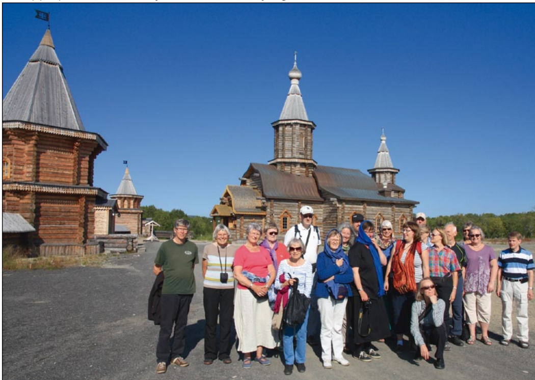
Grappa på besøk i det nye klosteret i Petsjenga.