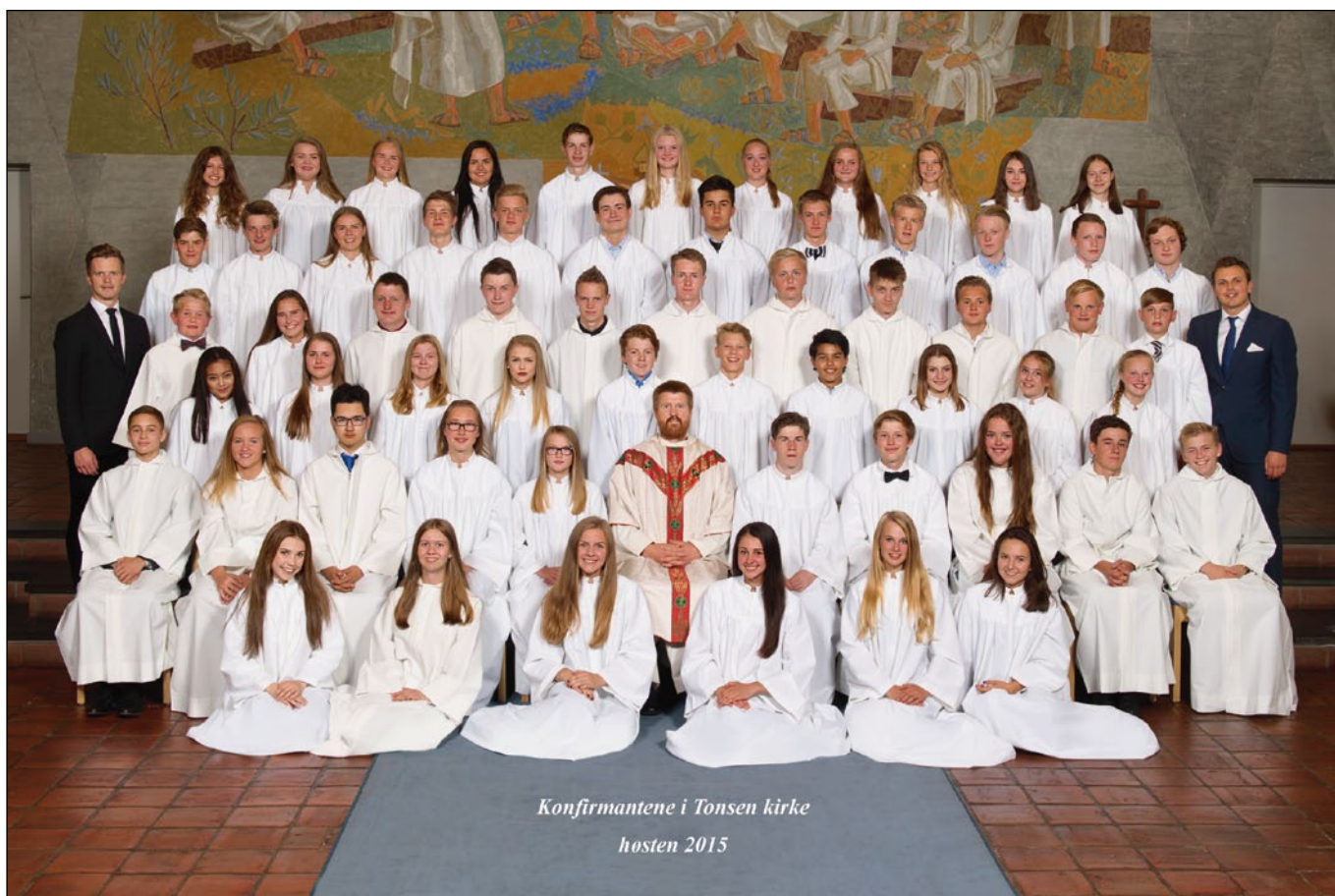
Konfirmantene i Tonsen kirke høsten 2015

Dersom du oppgir fødselsnummer, får du skattefradrag for gaver som samlet utgjør mer enn kr 500,- (maks kr 20 000,-) for året 2015. Husk fullt navn og adresse.