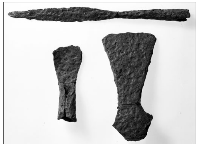
Gjenstander funnet ved utgravingen på Lofthus i 1961.