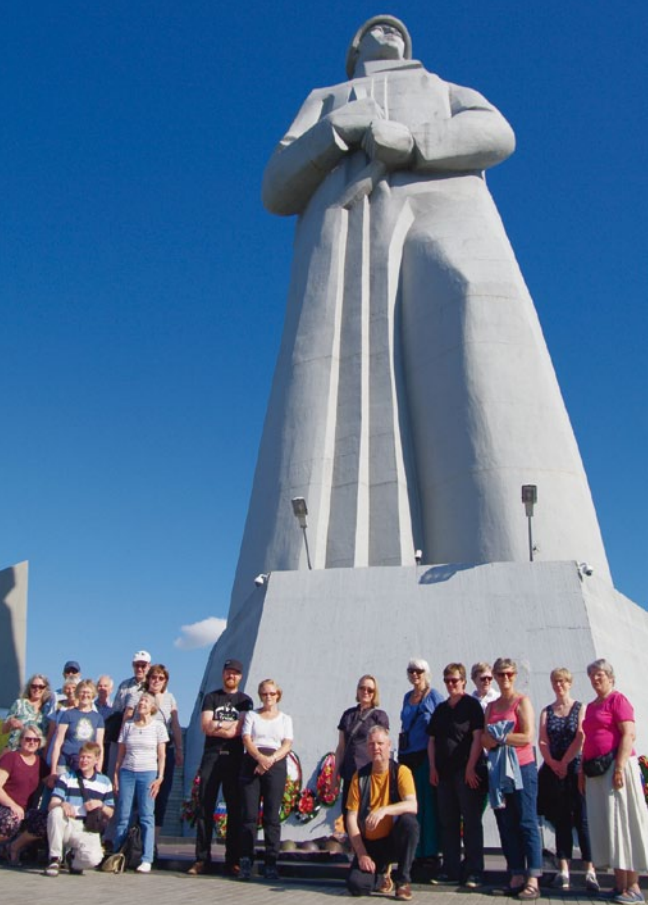
Grappa er samlet ved Alosjamonumentet i Murmansk.