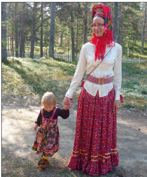
Kvinne og barn i tradisjonelle skoltesamdrakter i Sevettjärvi.