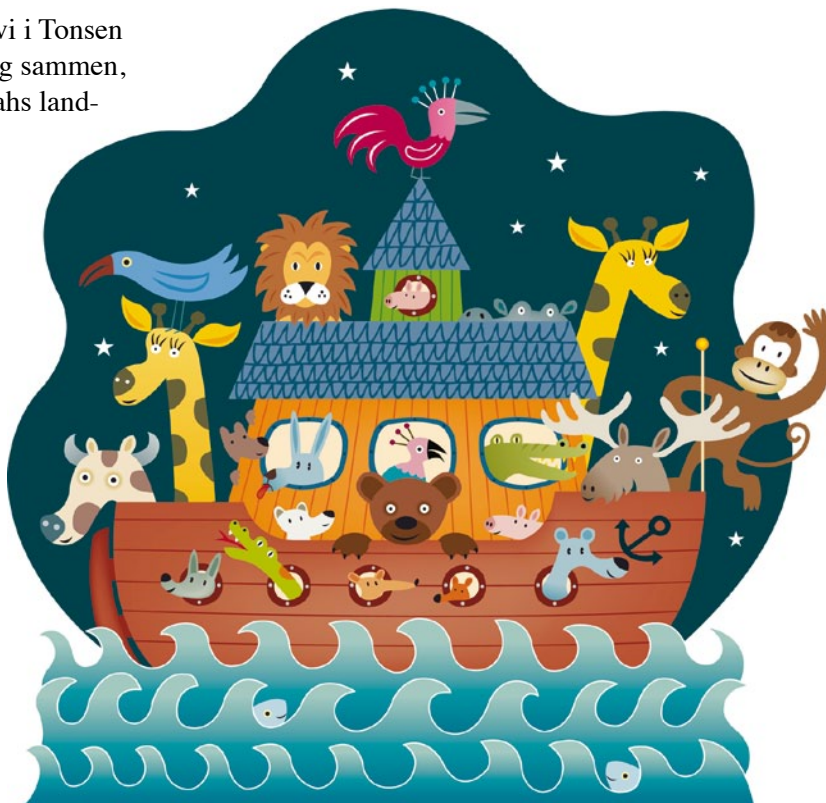
Illustrasjon: Johnny Dyrande