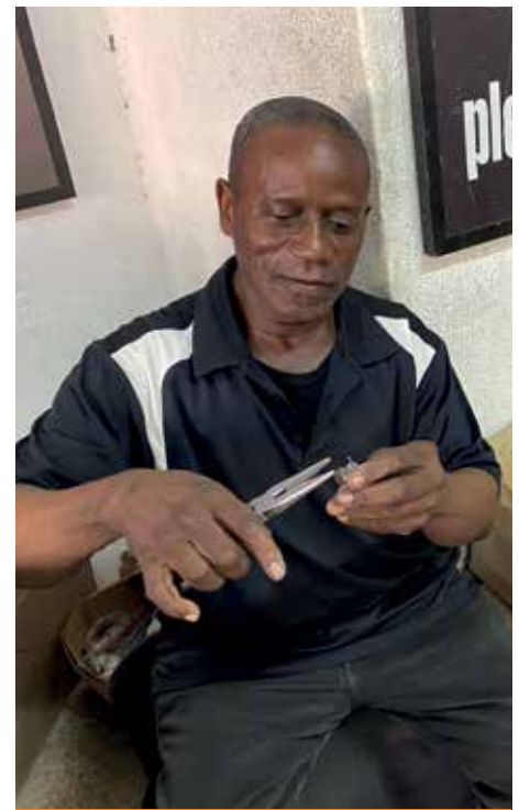
20 HENDENE BAK DÅPSENGLENE