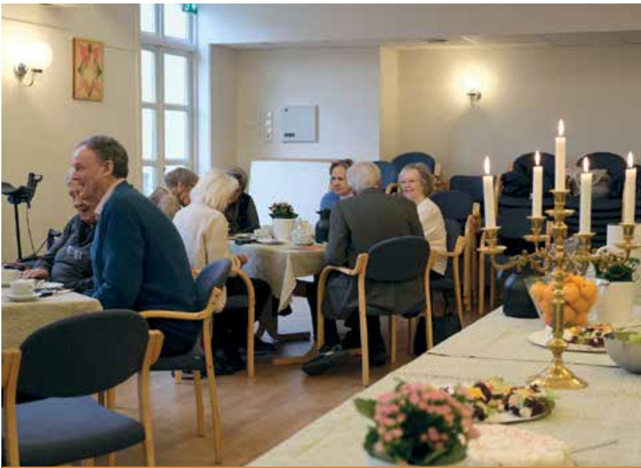
10 UKESTART MED FELLESSKAP