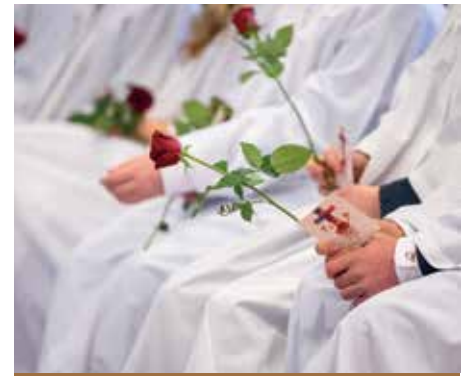
18 KONFIRMANTER 2024