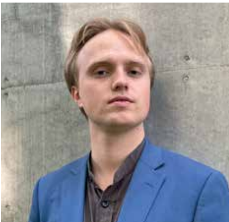
7 NY KANTOR