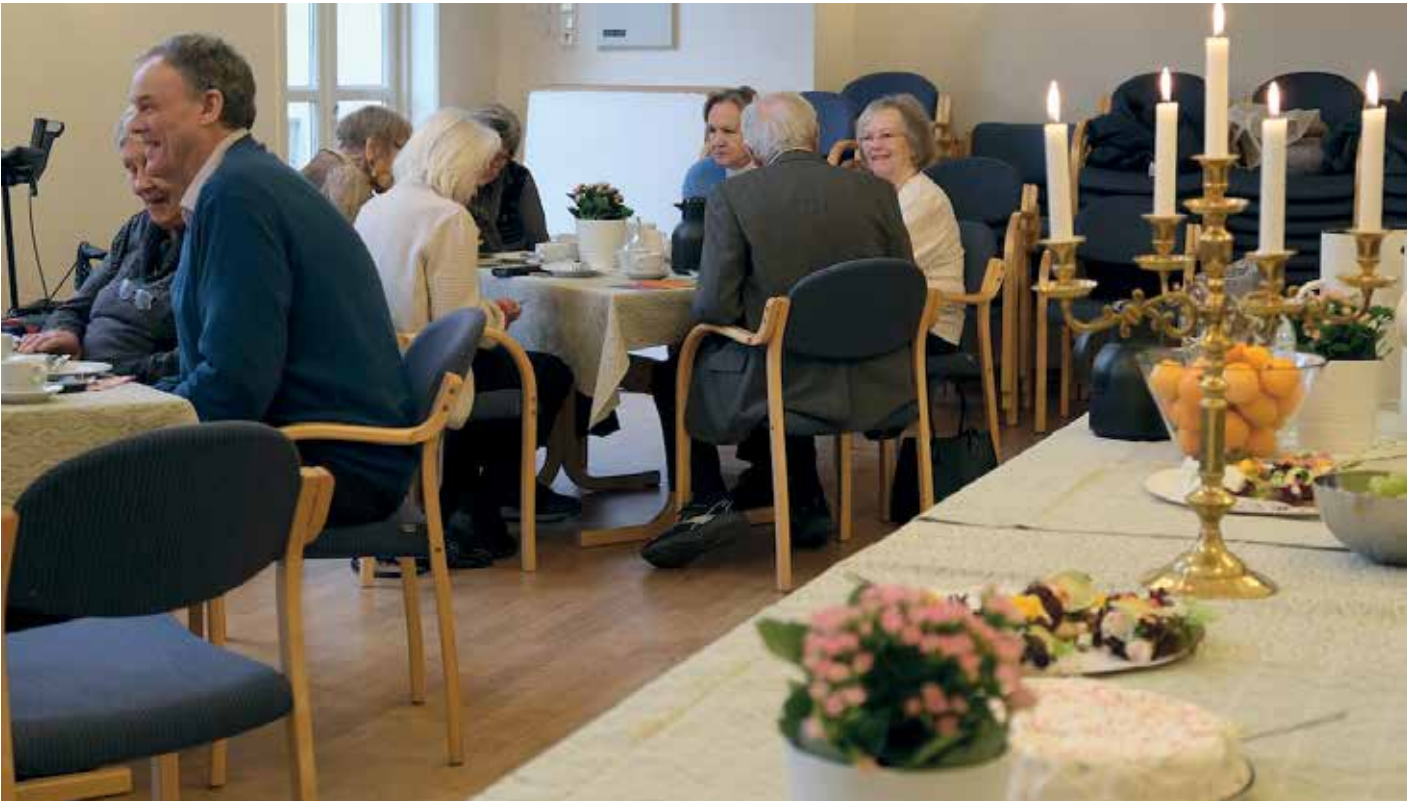
Menighetshuset er vellegnet for ulike fellesskapssamlingre

Som menneske lever vi ikke alene på jorda, vi trenger hverandre og et fellesskap. Derfor skjer det noe hver mandag i Ullern menighet. I denne artikkelen kan du lese mer om programmet og finne kontaktinformasjon. Vi har spurt noen av dem som bruker tilbudene, om hvorfor de kommer og hvorfor tilbudet er viktig. God lesing, og velkommen en mandag!