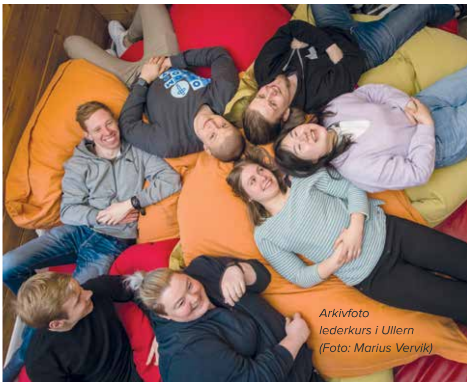
Arkivfoto lederkurs i Ullern