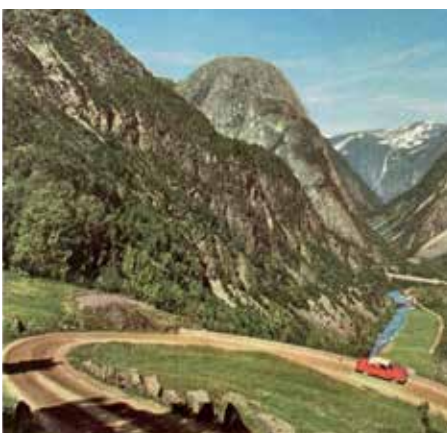
4 NASJONALE TURISTVEGER