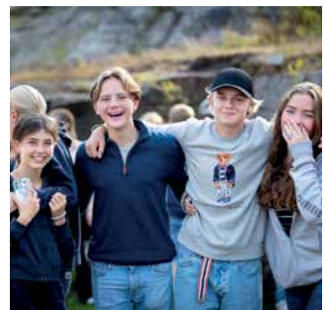
19 KONFIRMANT 2025?