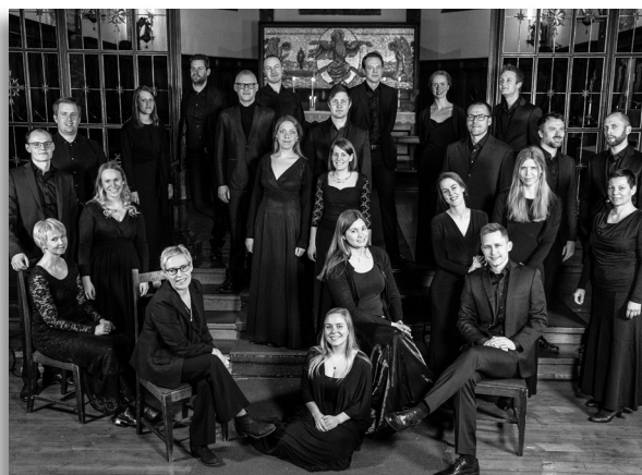
Uranienborg Vokalensemble

Kirken er et yndet sted for kor å leie til konserter, CD- innspillinger og andre lignede arrangementer. I 2019 var kirken leid ut 12 ganger, noe som er en viktig inntektskilde for menigheten.